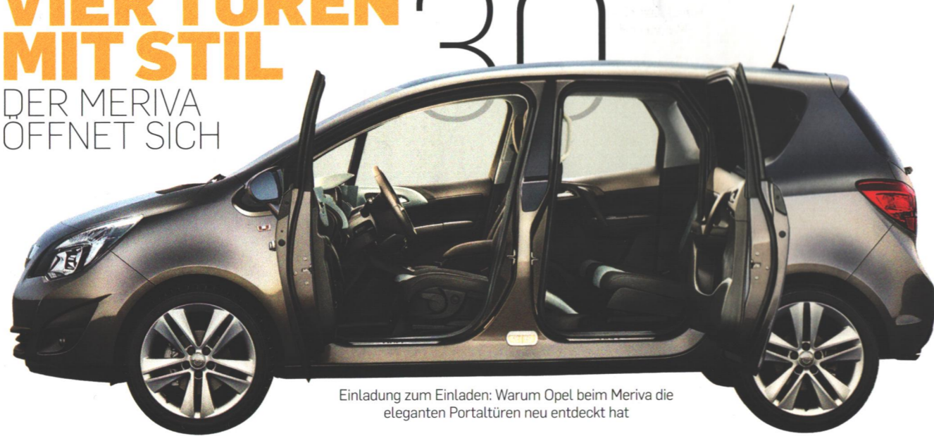
Einladung zum Einladen: Warum Opel beim Meriva die eleganten Portaltüren neu entdeckt hat