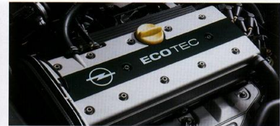
Der 16V-ECOTEC-Motor mit 100 kW (136 PS) zeichnet sich aus durch exzellente Fahrleistungen und äußerst sparsamen Verbrauch.

Elektrische Fensterheber vorn und Zentralverriegelung gehören bei den stärkeren Motorversionen V6 ECOTEC und Turbo bereits zur Grundaus-