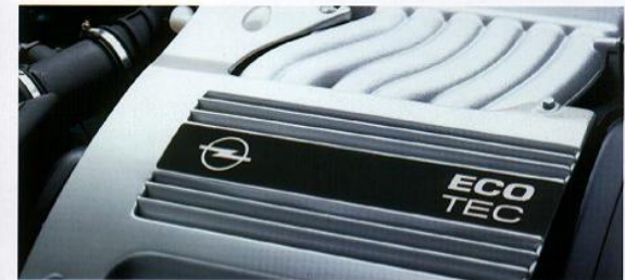
V6-ECOTEC-Motor. Das kompakte High-Tech-Triebwerk mit 2,5 Liter Hubraum, 24 Ventilen und 125 kW (170 PS).