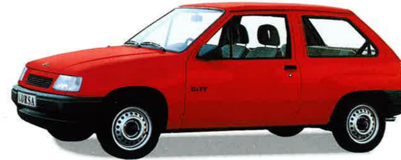
Corsa City, die sparsame Alternative fürs Shopping mit Komfort. Denn Stoßfänger, Nebelschlußleuchte, höhenverstellbare Sicherheitsgurte sowie höhen- und neigungsverstellbare Kopfstützen vorn sind – unter anderem – Serienausstattung. Den Corsa City gibt es jetzt auch als wirtschaftlichen 1.5-l-Diesel. Starten, gut fahren und leicht parken.