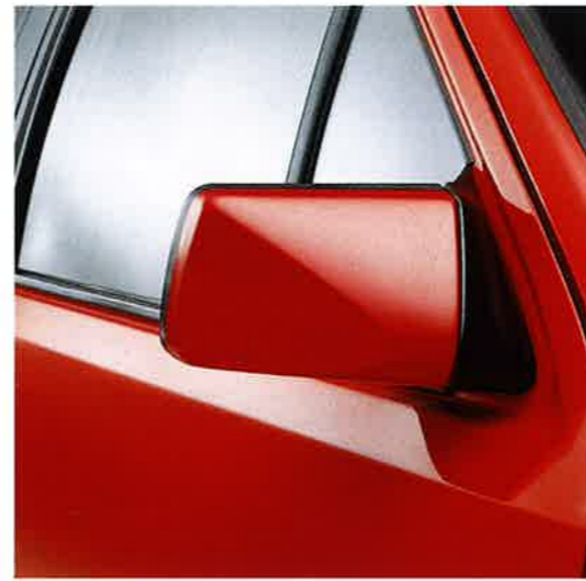
Corsa Swing-in, modernes Styling mit Format. Kompakt, attraktiv, sympathisch. Man sieht ihm das dynamische Fahrvermögen an, seine Wendigkeit und Impulsivität. Die in Wagenfarbe lackierten Außenspiegel unterstreichen das attraktive Äußere des neuen Corsa Swing-in.

Zum Beispiel der Corsa Swing-in. Mit dem serienmäßigen Radio SC 202 und speziellem Swing-in Polsterdesign kommt ganz neuer Schwung auf. Und noch mehr Spaß am Fahren. Welche Neuheiten die Corsa-Modelle zu bieten haben, können Sie hier sehen und natürlich bei Ihrem freundlichen Opel Händler.