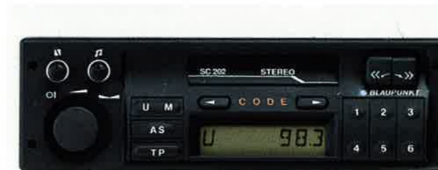
Das Autoradio SC 202 sorgt in jeder Situation für Unterhaltung und Information. Das Blaupunkt-Radio, jetzt auch im GSi serienmäßig, verfügt u. a. über Cassettenteil, digitalen Sendersuchlauf und Diebstahl-Codierung.