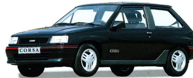
Mit seinem starken 1.6-l-Triebwerk mit 74 kW (100 PS) zeigt das Kraftpaket gerade auf der Autobahn seine ganze Leistungsfähigkeit. Sein sportliches Temperament überzeugt mit serienmäßigen Extras wie 5-Gang-Sportgetriebe, Sportfahrwerk, -lenkrad und -sitzen.