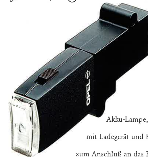
Akku-Lampe, 1790535, mit Ladegerät und Halterung zum Anschluß an das Bordnetz.