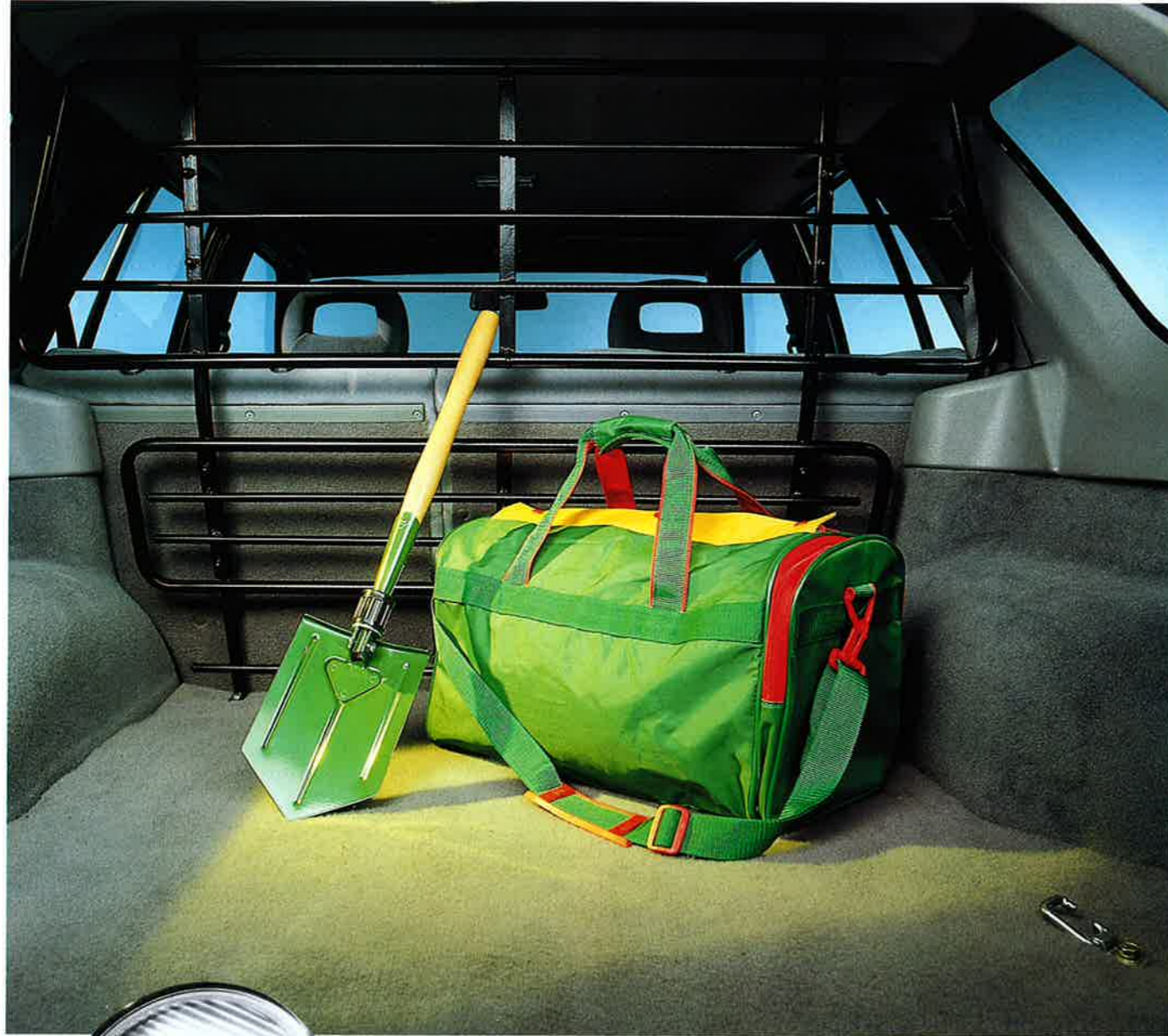
Hundeschutzgitter, 1726151, Zusatzgitter unten, 1726152.