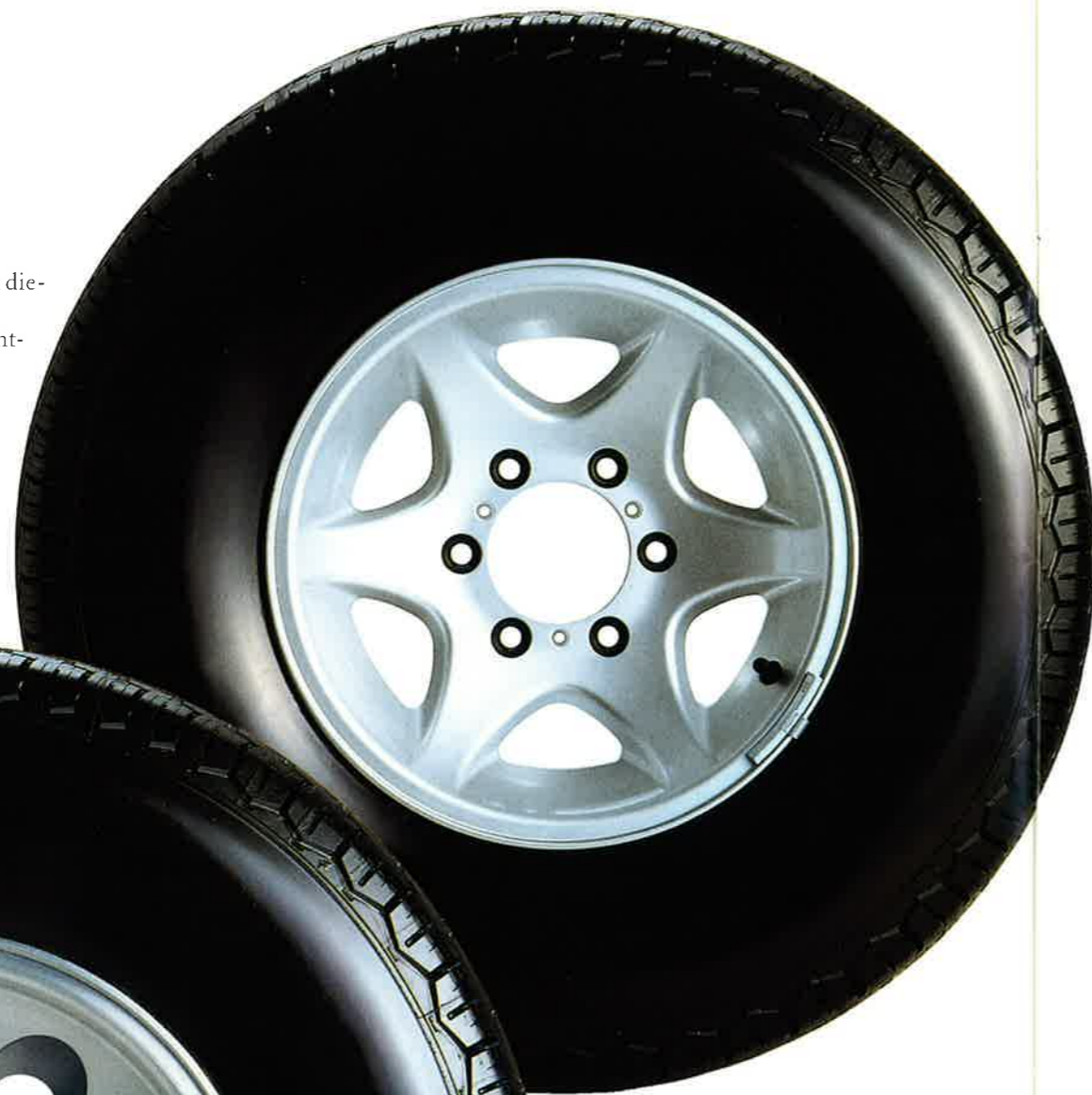
Leichtmetallrad, 6 Speichen, 10 02 365.

Die dynamische Optik dieser sportlichen Leichtmetallräder unterstreicht den individuellen Charakter Ihres persönlichen Frontera.