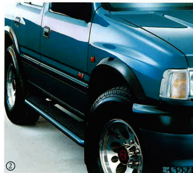
① Seitliche Trittbretter, Edelstahl, 1754 004.