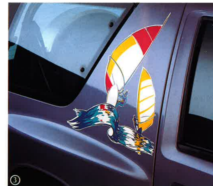
③ Dekor-Set für Frontera Sport, Motiv Windsurfer, 1753 700, für beide Mittelsäulen und Reserveradabdeckung.