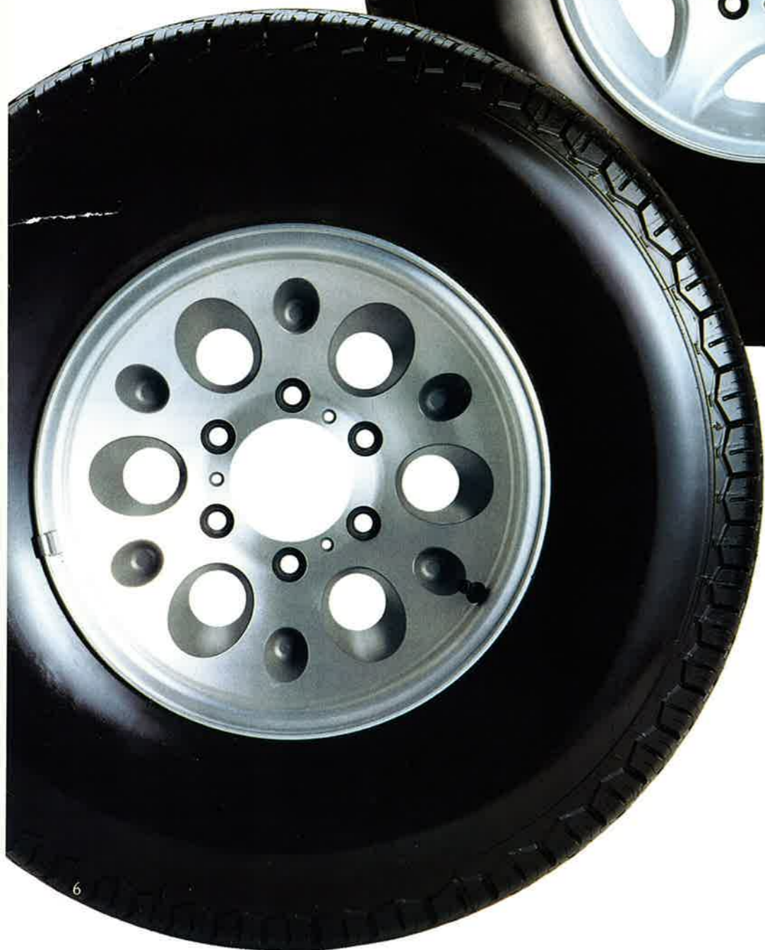
Leichtmetallrad, 6 Löcher, 10 02 364.