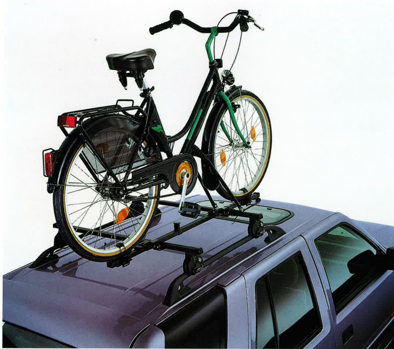
Fahrradträger, bestehend aus dem Basissatz, 1732454, und dem Zubehörsatz, 1732555. Die Montage erfolgt am Boden.