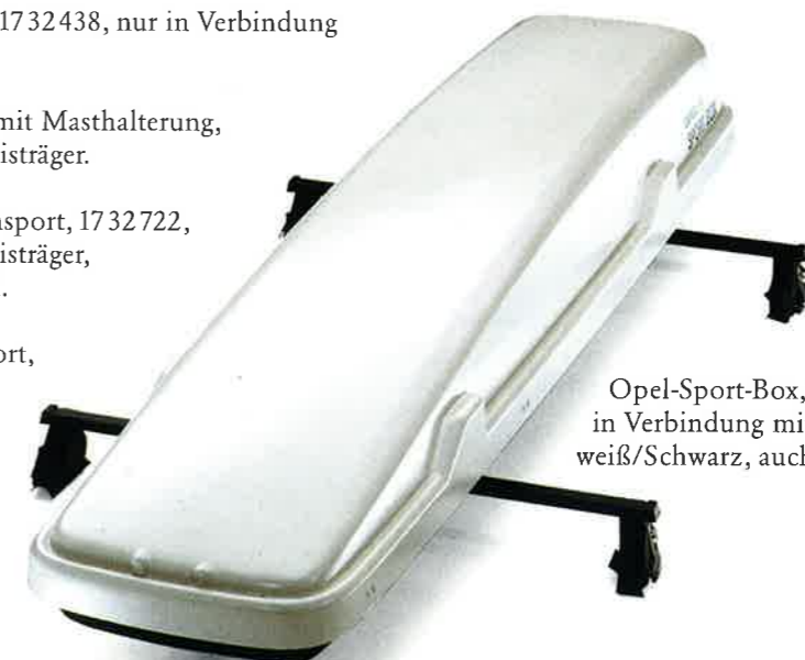
Opel-Sport-Box, 1732852, abschließbar, nur in Verbindung mit Basisträger, Champagnerweiß/Schwarz, auch in Wagenfarbe lackierbar.