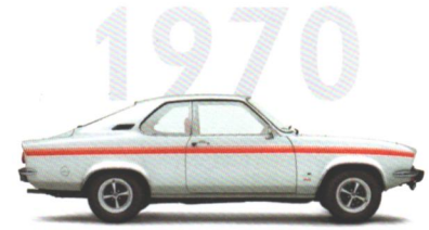
Opel Manta Der Sportwagen für alle