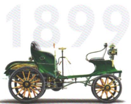
Opel Motorwagen Das erste Auto von Opel