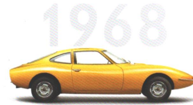
Opel GT Das Traumauto für alle