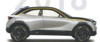
Opel GT X