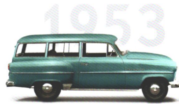
Opel Olympia Rekord Der erste Kombi in Deutschland