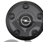
RADNABENABDECKUNG ZHYV, ZHYW, ZHZQ Serie