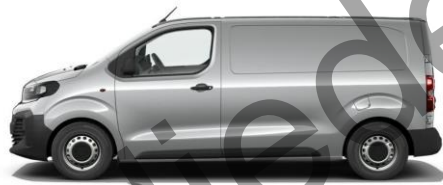
KONTRAST-GRAU M0F4 600,00 (714,00)