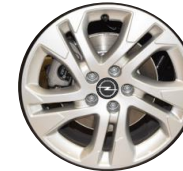
17-ZOLL-LEICHTMETALLFELGE ZHZZ 650,00 (773,50)