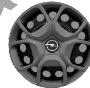
17-ZOLL-RADZIERBLENDE ZHYY Serie i.V.m. PDxx