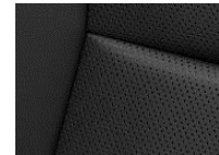
LEDER CLAUDIA CYFX Paket Luxury