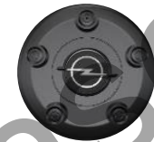
RADNABENABDECKUNG ZHYV, ZHYW, ZHZQ Serie