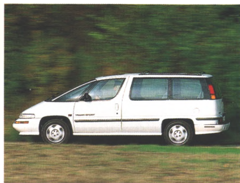
Viel Platz und Komfort bietet der Pontiac Trans Sport, den es mit 147 oder 173 PS gibt (Seite 30)

Recycling ist in allen Bereichen des Automobilbaus ein wichtiges Thema. Auch der neue V6-Motorblock wird aus wiederaufbereitetem Stahl gegossen.