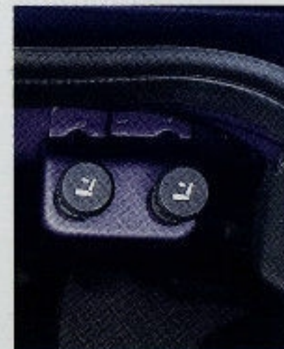
Die asymmetrisch geteilte, umklappbare Rücksitzlehne kann zum Schutz gegen Gepäckdiebstahl nur vom Kofferraum aus entriegelt werden.