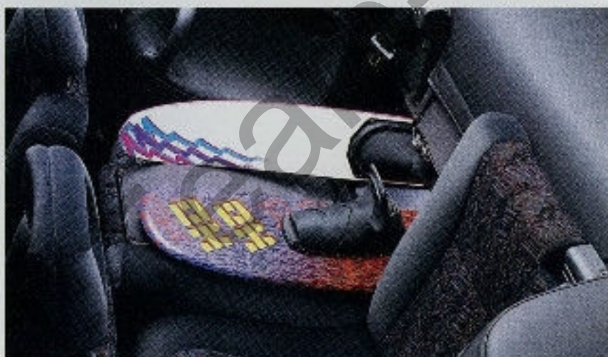
Die geteilte Rücksitzlehne mit Durchblademöglichkeit erlaubt durch einfaches Umklappen der Sitze problemlose und variable Zuladung.