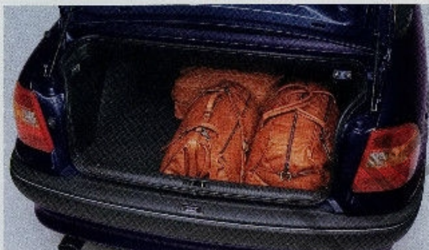
Mit einem Kofferraumvolumen von 390 Litern liegt das Astra Cabrio sogar über dem Fließbeckenniveau.

Wer in den Sportsitzen des Astra-Cockpits erst einmal Platz genommen hat, will sofort losfahren. Tun Sie's, und nehmen Sie Ihre Freunde mit – es wird für alle das reinste Vergnügen. Für Sie, weil „offen“ einfach mehr Spaß macht. Für alle Mitfahrer, weil so viel Platz vorhanden ist und die Fahrgeräusche so gering sind. Weil der Fahrtwind Ihnen angenehm leicht um den Kopf weht. Und wenn das Wetter doch mal umschlägt – Verdeck zu! Das Astra-Reinluft-Filter-System sorgt bei geschlossenen Fahrten für frisches Klima und saubere Luft.