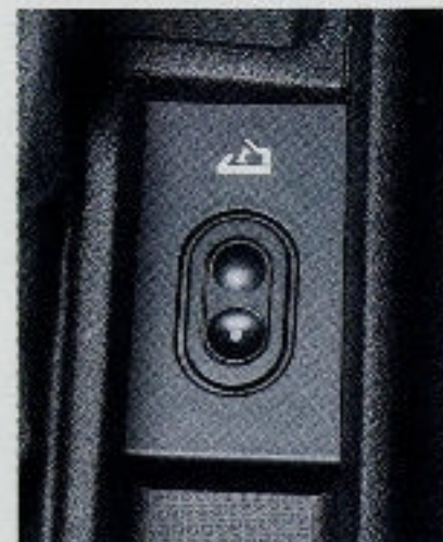
Auf Wunsch ist das Astra Cabrio mit elektrischem Verdeck erhältlich.