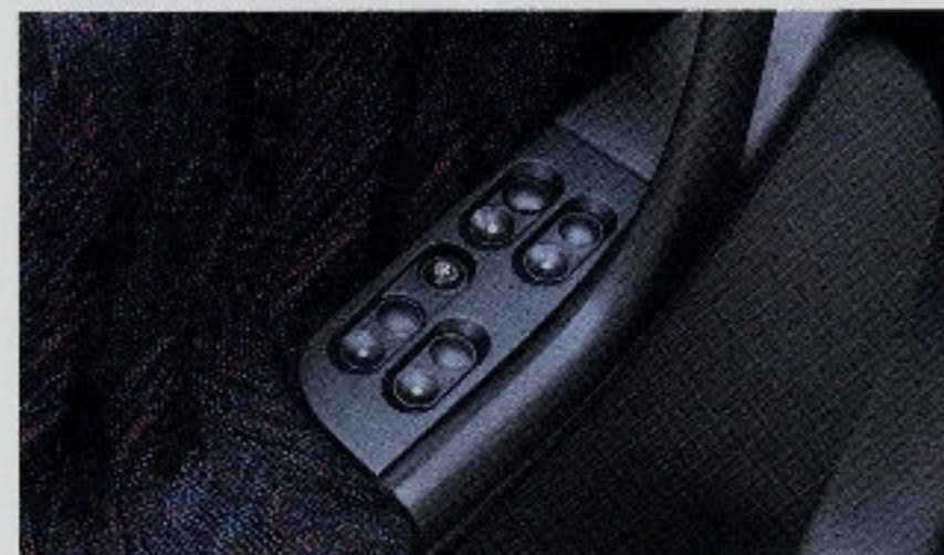
Elektrische Fensterheber sind eines der vielen Serienextras im Astra Cabrio.