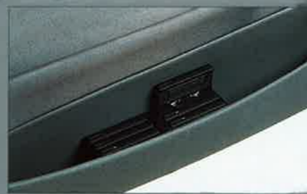
Cassettenbox, 17 82 621. Für 6 Cassetten, zur Montage im Türablagefach (Fahrerseite).

Perfekt zugeschnitten auf Ihre individuellen Bedürfnisse. Setzen Sie Ihren Corsa mit „viel Sinn fürs Detail“ in Szene.