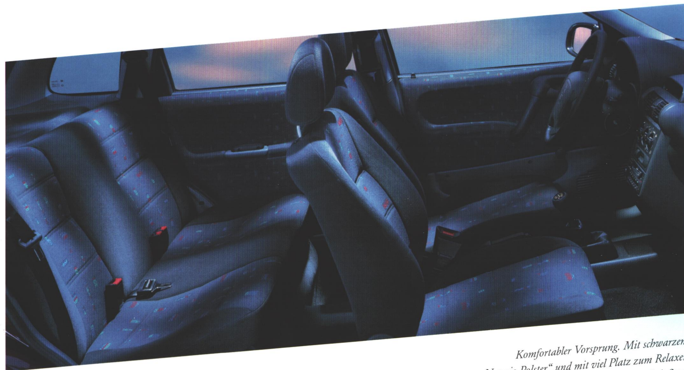
Komfortabler Vorsprung. Mit schwarzem „Navajo Polster“ und mit viel Platz zum Relaxen ist der Corsa einfach fitter.

Wer die bessere Fitness und die richtige Einstellung hat, wird am