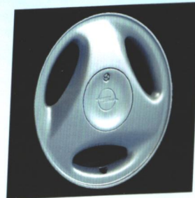
Wahlweise: Leichtmetallräder 5 1/2 J x 14 im 3-Speichen-Design.