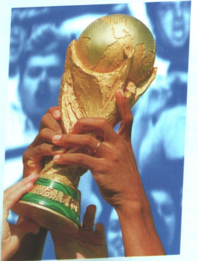
Der Opel Corsa: Gut trainiert, eilt er von Sieg zu Sieg. Meistverkaufter Kleinwagen 1994, 1995, 1996 und 1997.