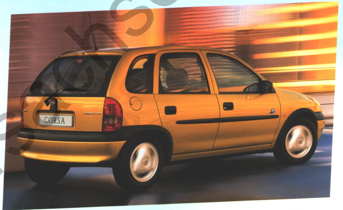
Auf das richtige Outfit kommt es an. Im praktischen Stürer machen Sie eine ausgesprochen gute Figur.