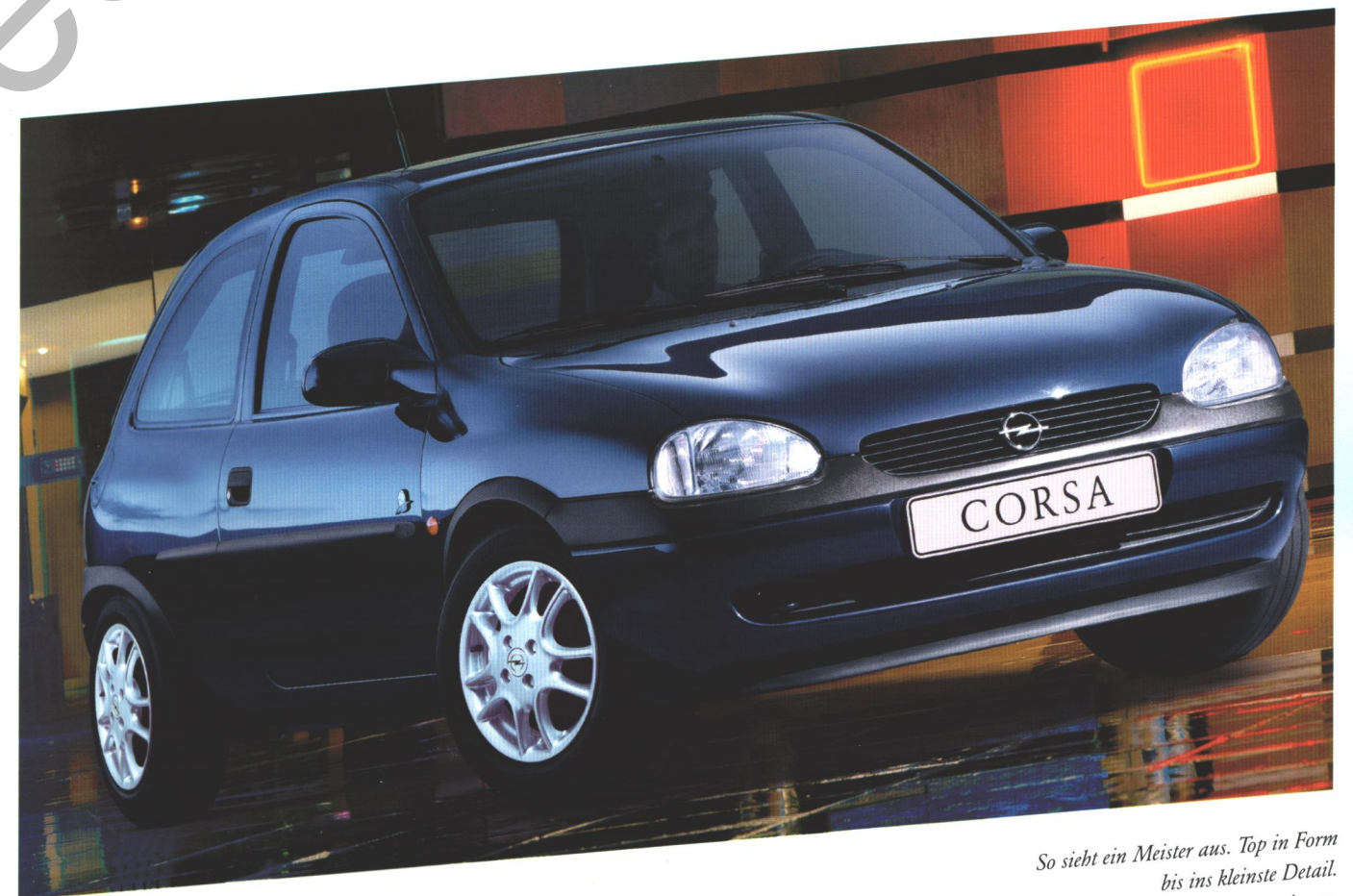
So sieht ein Meister aus. Top in Form bis ins kleinste Detail. Ein sicherer Typ für alle Situationen.