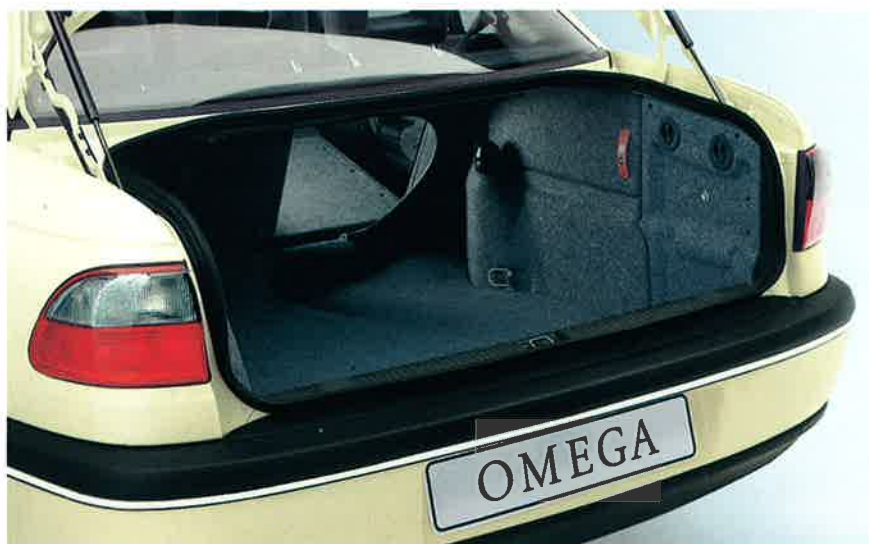
Abb. unten: Der Kofferraum der Omega Limousine. 530 Liter Volumen und eine dreigeteilte Rücksitzlehne mit Durchladevorrichtung für flexible Laderaumgestaltung.

Alternativ kann bereits ab Werk die Montage des Adapters für das selbstkontaktierende Splithoff-Dachschild (Best.-Nr. 0450) oder für das selbstkontaktierende Kienzle-Dachschild (Best.-Nr. 0451) vorgenommen werden.