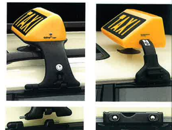
Abb. rechts: Splitthoff-Dachschild mit Adapter.

Die Innenleuchte vorn ist mit 2 einzeln schaltbaren Leseleuchten versehen. Die zweite Innenleuchte sowie zwei weitere Leseleuchten befinden sich im Fond.