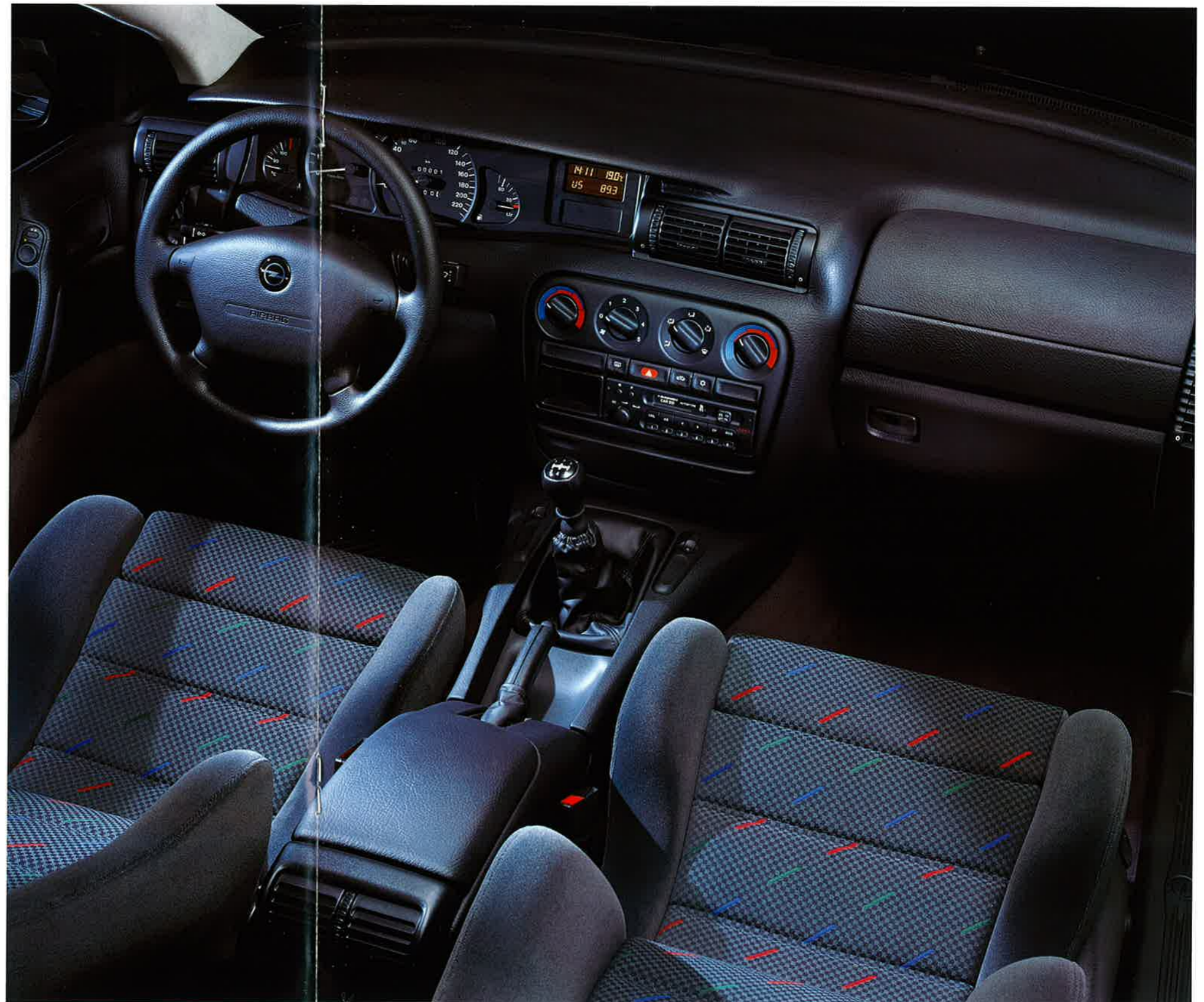
Sitze mit variabler Oberschenkelauflage. Polsterstoff „Chequers“.