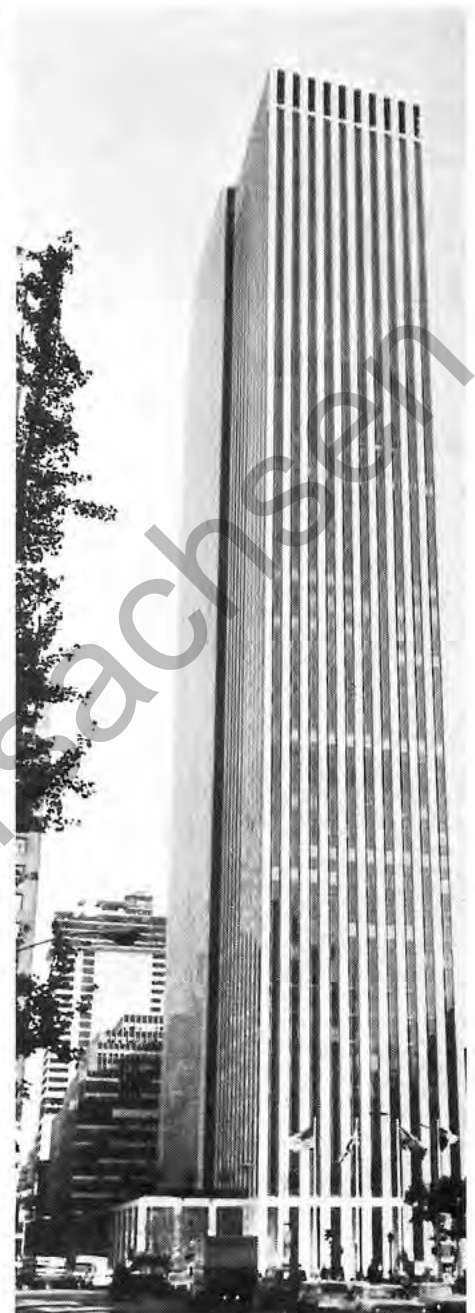
In diesem 255 m hohen Wolkenkratzer in New York sind die Räume der GM-Übersee-Organisation untergebracht.

sophie „Dezentralisierung bei gleichzeitig koordinierter Kontrolle“. Das heißt, jedem Unternehmen ist die Verantwortung voll übertragen, die Einhaltung einer einheitlichen Geschäftspolitik wird jedoch koordiniert. Für Opel wurde GM gleich nach 1929 bedeutsam durch Übernahme des ganzen Exports der Opel-Fahrzeuge, was zu einer erheblichen Absatzsteigerung führte. Auch heute noch läuft der Auslandsvertrieb über GM. Opel-Fahrzeuge werden auch einigen GM-Montagewerken in zerlegtem Zustand angeliefert, wegen der Zoll- und Importbestimmungen oft der einzige Weg, Fahrzeuge in diese Länder zu liefern. Zur Zeit sind solche Werke in Belgien, Portugal, Marokko, Zaire, Südafrika, Malaysia, Korea und Uruguay für Opel tätig. G.