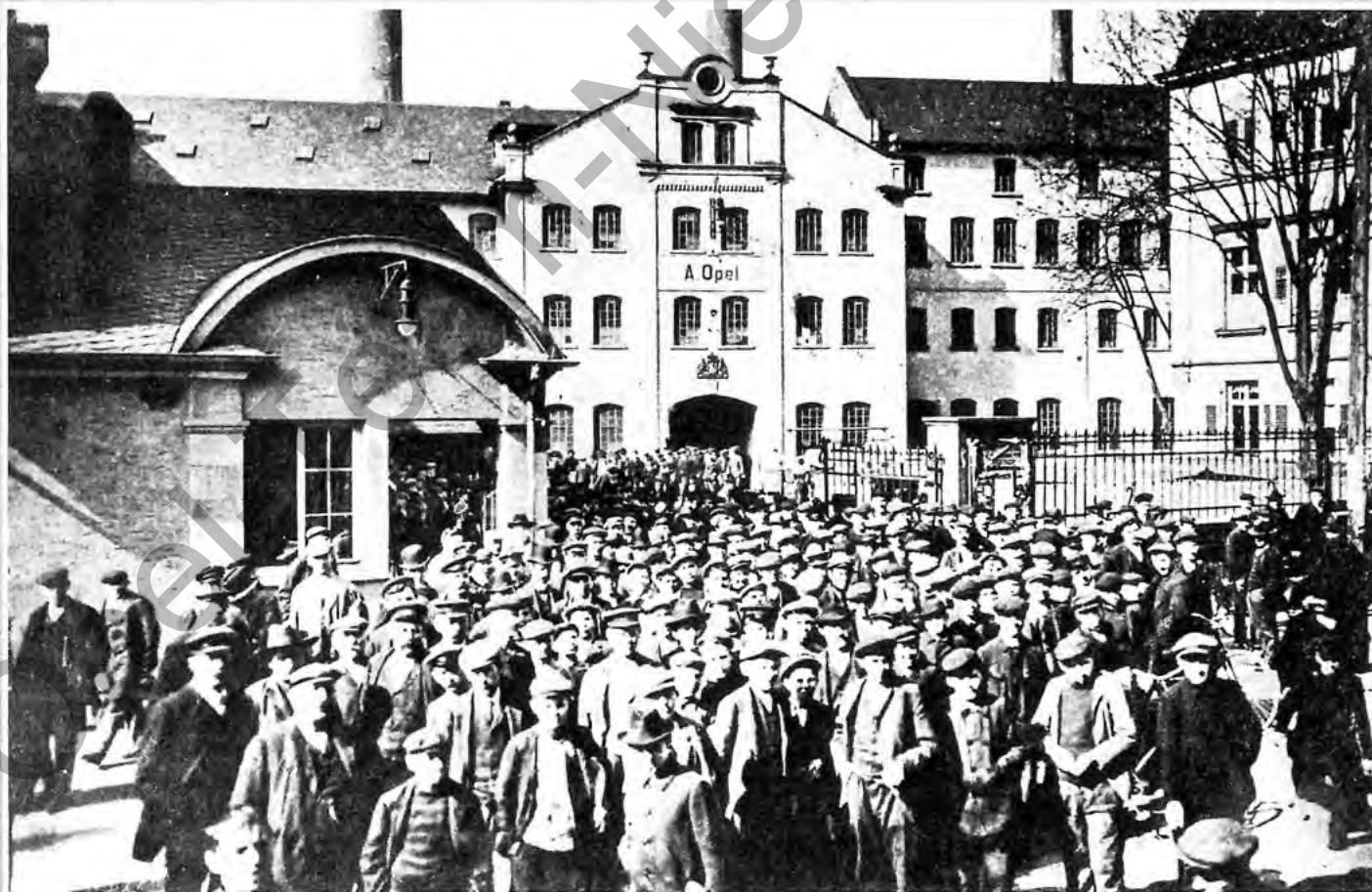
„Opel macht Mittag“: Das Hauptportal um das Jahr 1910. Diese Reproduktion zeigt, wie zur Pause ein Teil der Belegschaft – damals etwa 3.000 Mitarbeiter – das Werk verläßt, um zu Hause, in einer nahen Wirtschaft oder in der außerhalb gelegenen Kantine das Mittagessen einzunehmen.

Recht anschaulich ist das Thema Mittagessen in der Festschrift zum goldenen Jubiläum 1912 abgehandelt: