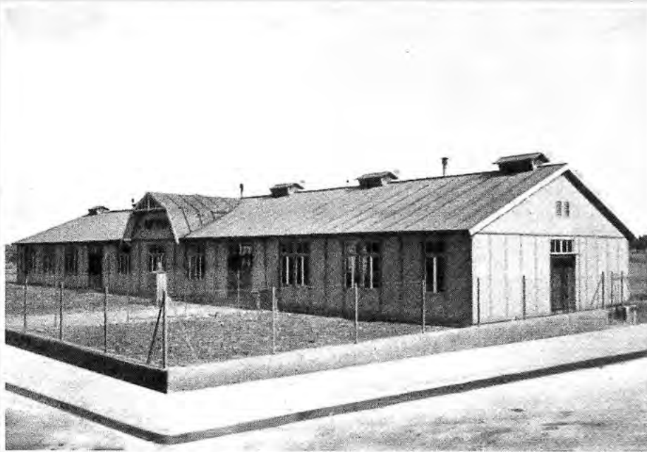
Diese „Arbeiter-Speisehalle“ befand sich in der heutigen Rheinstraße.