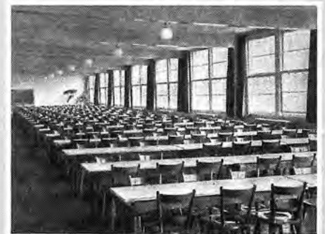
Repro von der ersten Opel-Großküche mit Speisesaal im H 32.