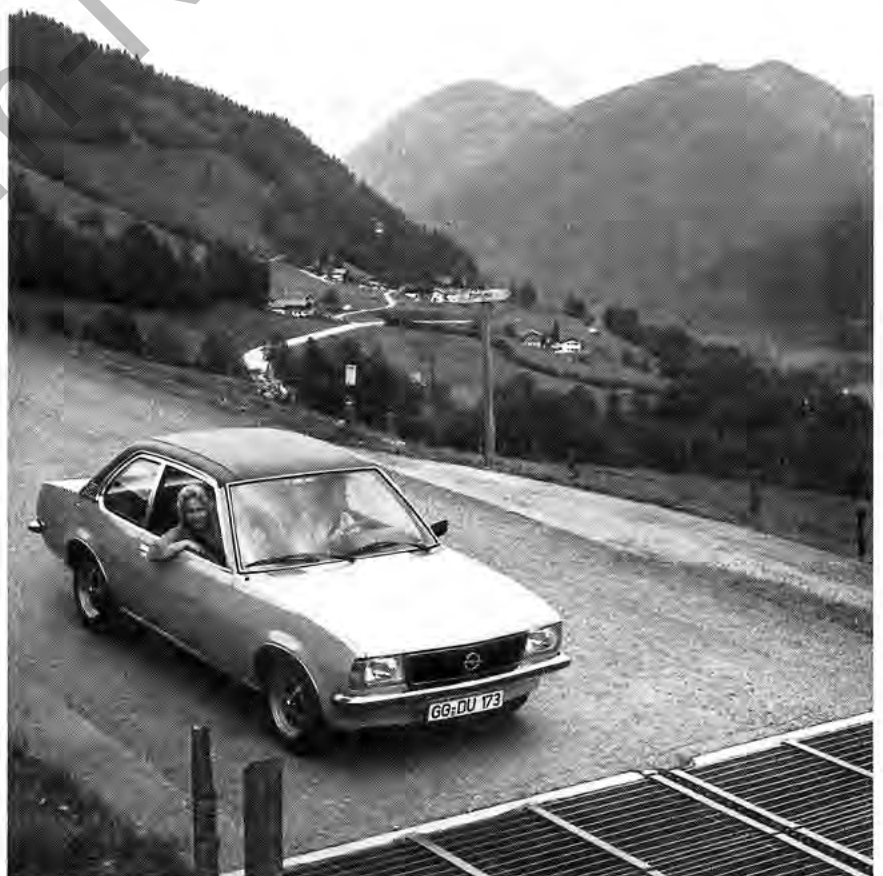
Einer der Spitzenreiter des vielseitigen Opel-Programms: der ASCONA.

scheibe aus Einscheibensicherheits- oder aus Verbundglas ohne Mehrpreis. Neben der Ausgewogenheit der guten Eigenschaften aller Opel-Modelle hat auch dieses hohe Ausstattungsniveau mit zu der Spitzenstellung des Rüsselsheimer Unternehmens in der bundesdeutschen Zulassungsstatistik beigetragen.