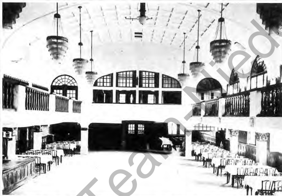
Der große Saal des einstigen „Rüsselsheimer Hofes“. Diese vor allem bei den „Opelbeamten“ (so hießen die Angestellten damals auch im offiziellen Sprachgebrauch) beliebte Gaststätte befand sich gegenüber dem Hauptportal. In den unteren Räumen des Gebäudes wurde das Essen verabreicht.

„Zahlreich sind die Arbeiter, die während der Mittagspausen von ihren Angehörigen Speisen zugetragen erhalten. Diesen Leuten ist Gelegenheit geboten, ihre Mahlzeit in Ruhe und Bequemlichkeit in einem der großen Speisesäle einzunehmen, die in den unteren Räumen des dem Haupteingang gegenüber liegenden Hotels ‚Rüsselsheimer Hof‘ untergebracht sind. Dort werden auch gegen mäßige Preise warme Suppen und warme Fleischspeisen verabreicht, so daß der Mangel eines eigenen Heimes in diesem Falle nicht empfunden