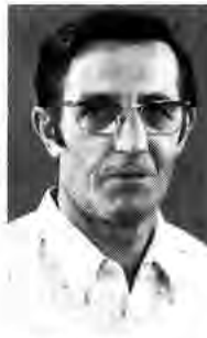
Ernst Hummel Chassisbau I 3.8.1976