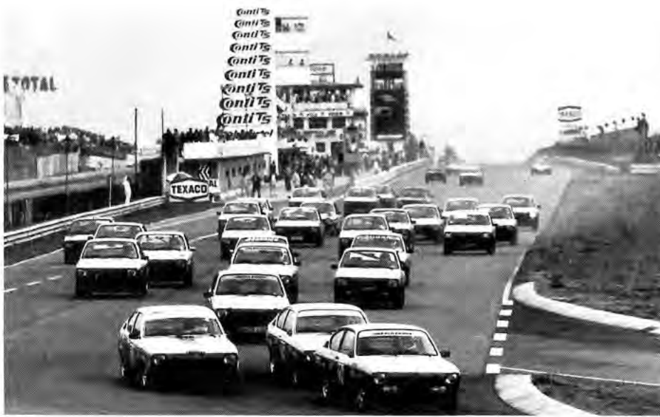
Start zum Opel-Markenrennen: Abbruch durch Wolkenbruch.