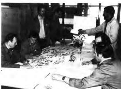
Die „Wiener“ bekommen Flugtickets.