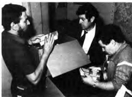
Kulturelle Betreuung: Buchausgabe.