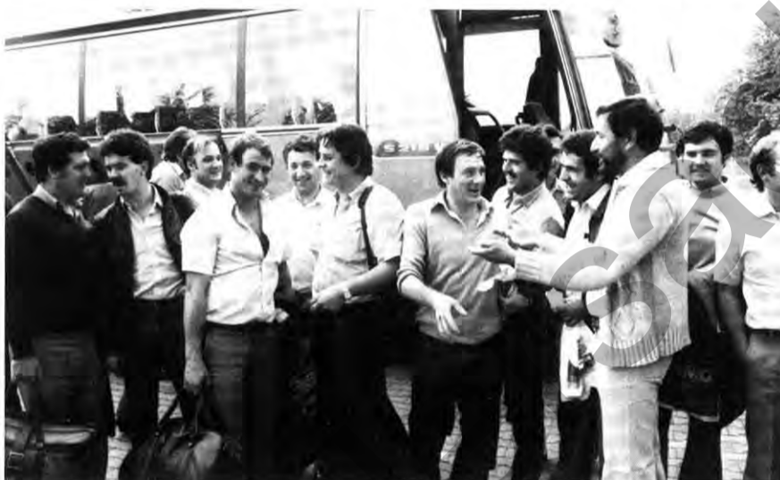
Von einem kurzen Heimurlaub zurück: Begrüßung am Wohnheim.

Alle Betreuungstätigkeiten erfordern eine Menge Vorbereitung und auch Verwaltungsarbeit. Das kostet viel Zeit. Mit dem Werk Rüsselsheim muß Kontakt gehalten werden, weil viele Dinge zentral für alle Trainees, die in Opel-Werken arbeiten, gesteuert werden. Ein Dienstwagen steht zur Verfügung, sonst wäre es einfach nicht zu schaffen. Alles läuft, alles wird getan, damit sich unsere Gäste wohl fühlen.