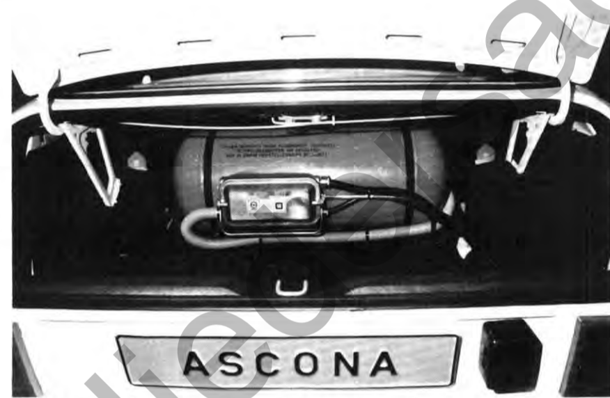
Ein in unserem Ascona eingebauter Opel-Flüssiggastank.

Kostenbewußtes Autofahren. Dichter werdendes Tankstellennetz. Umweltfreundliches Fahren – Autogas wird vom Motor nahezu ohne Rückstände verbrannt. (Einzelheiten, Beratung und nachträglicher Einbau bei den Opel-Händlern.)