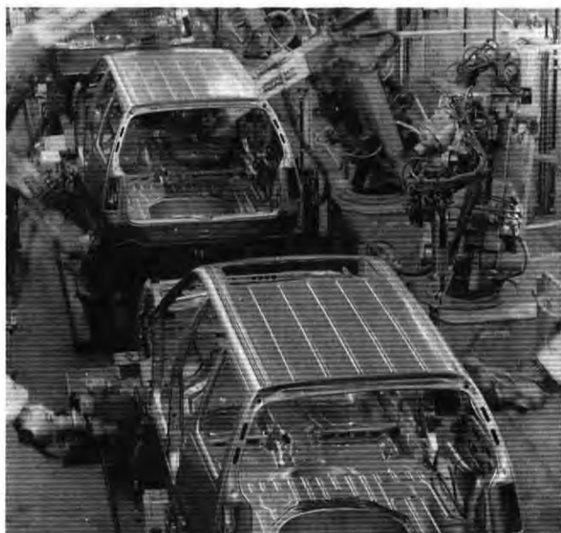
Dauerläufer: Rund um die Uhr werden jetzt Kadett gebaut