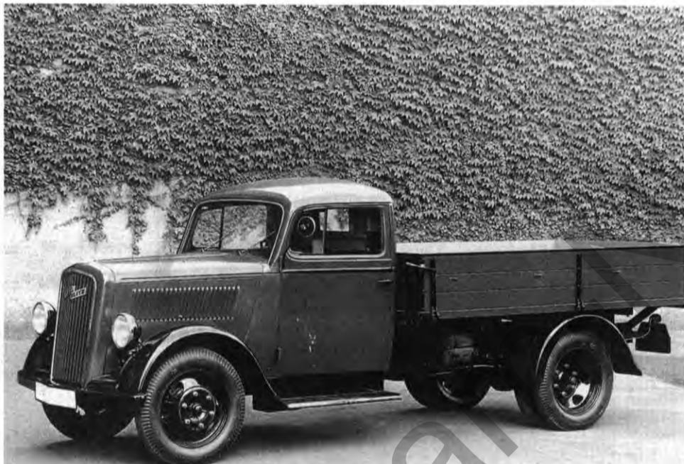
Blitz: Werksangehörige gaben dem Opel-Lastwagen seinen Namen