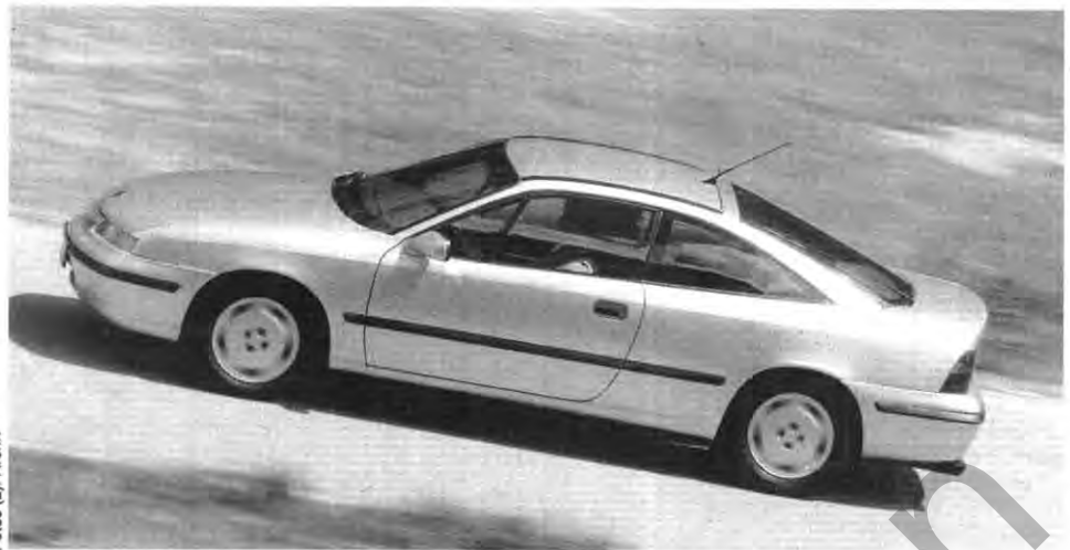
Aussicht: Schon jetzt gibt es großes Interesse am Calibra

Zeichen setzte Opel auch mit den Top-Modellen Omega 3000 und Senator 3.0i mit 24-Ventil-Motor. Diese Fahrzeuge werden, wie das neue Sport-Coupé Calibra, das im Sommer diesen Jahres auf den Markt kommt, sogar euro-