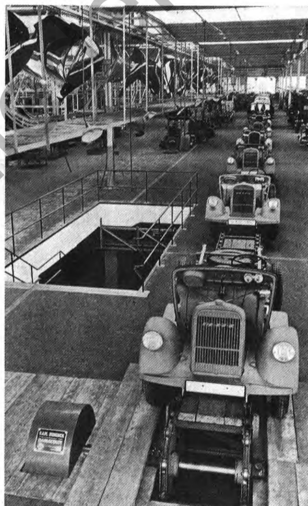
Blitzkarriere: Fertigung am laufenden Band

Unglaublich, aber wahr, Onkel Franz-Eugen hatte nicht übertrieben: Nach einer Bauzeit von nur 190 Tagen war das Werk vollendet, am 18. November des Jahres 1935 rollte tatsächlich der er-