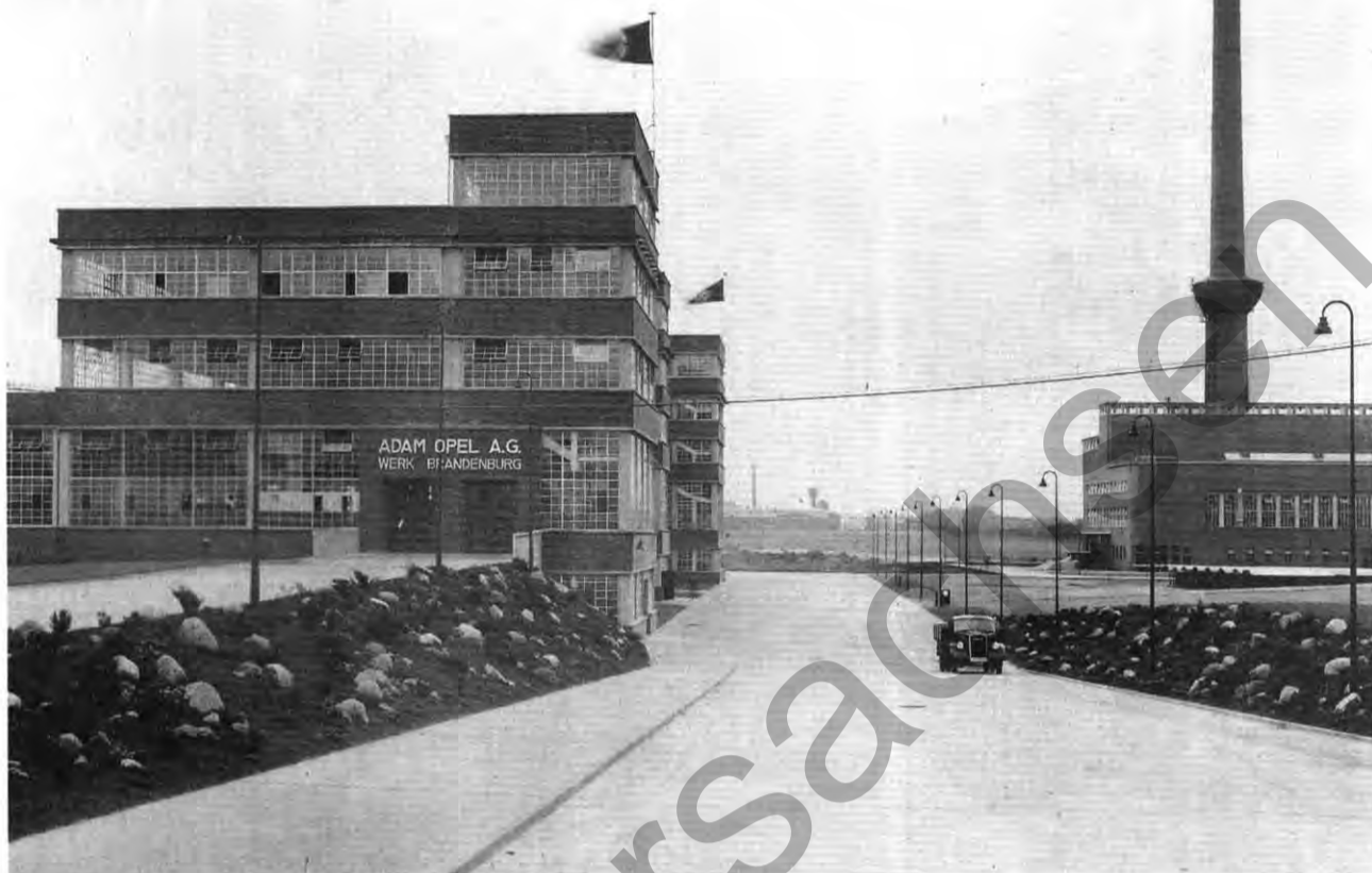
Blitzlicht: Aufnahme aus dem Werk Brandenburg