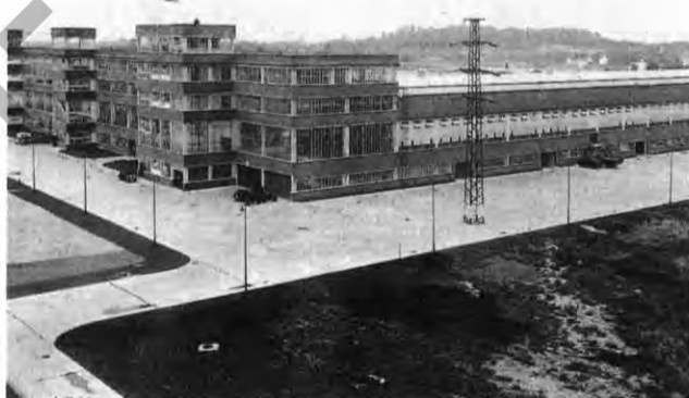
Blitzwürfel: Streng geometrischer Aufbau der Fabrikanlage

Ja, dieses neue Opel-Werk in Brandenburg war wirklich ein Projekt der Superlative, sein Werksgelände umfaßte 850 000 Quadratmeter, auf denen großzügig verteilt die Fabrikgebäude errichtet wurden, allein die Hauptwerkshal-