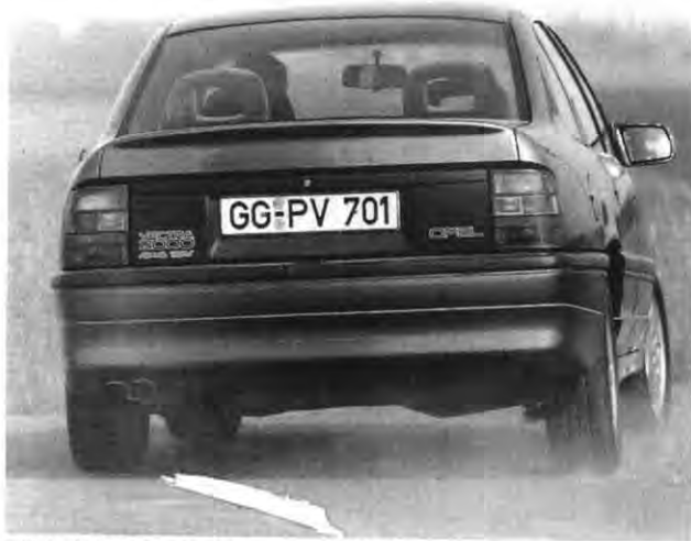
Rücksicht: Der Vectra war 1989 der Renner

te in einem großartigen Finale gegen Schweden seinen Titel. Und Jörg Roßkopf und Steffen Fetzner wurden Tischtennis-Weltmeister im Herrendoppel gegen Teilnehmer aus 90 Nationen. Im Motorsport gewannen Sepp Haider und Ferdi Hinterleitner die Internationale Deutsche Rallye-Meisterschaft auf einem 220 PS starken Kadett GSi 16V. ng