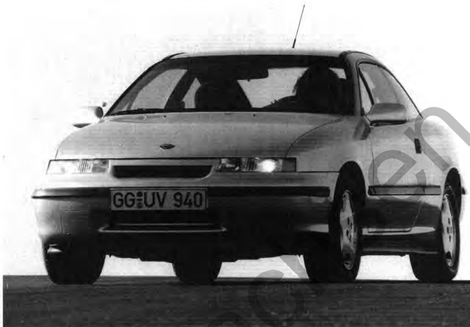
Leistungsträger: 100 Mitarbeiter werden Testfahrer für den Calibra