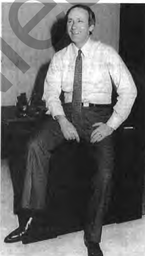
Zuversicht: Louis R. Hughes

Opel Post: Welches war die bedeutendste Veränderung für das Unternehmen im vergangenen Jahr?