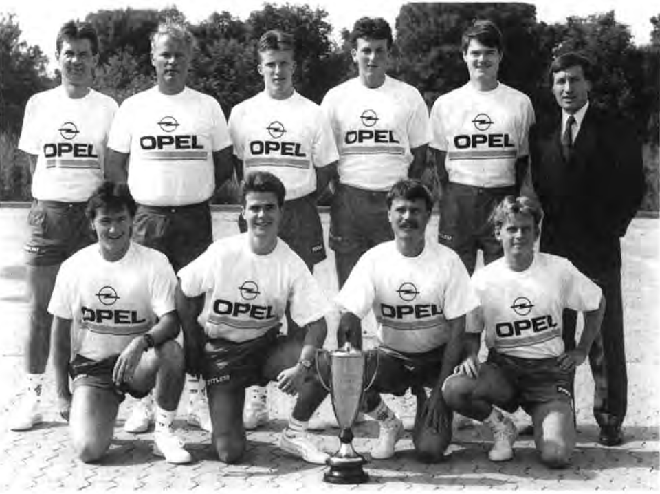
Team: Die erfolgreichen Tischtennis-Sportler von Borussia Düsseldorf