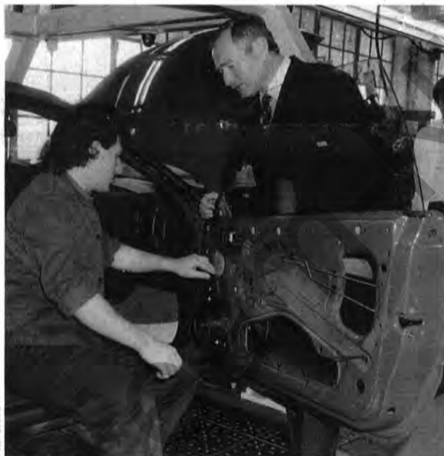
Pionierarbeit: Vorbereitung auf der Pilotlinie