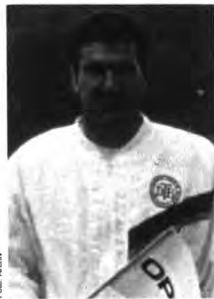
Tennis-Crack: Charly Steeb