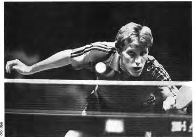
Konzentration: Doppel-Weltmeister Roßkopf will den Aufschlag-Rückschlag verbessern