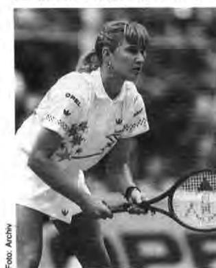
Auf Distanz: Steffi Graf

Steffi Graf ist mit dem, was Boris Becker in jüngerer Vergangenheit zu gesellschaftspolitischen Fragen und Problemen von sich gab, längst nicht immer einverstanden. „Die meisten seiner Ansichten teile ich nicht. Boris versucht derzeit zu philosophieren, das kann er mit 50 machen, aber nicht in seinem Alter“, ging die Tennis-Weltranglistenbeste bei den „Australian Open“ zu ihrem Landsmann auf Di-