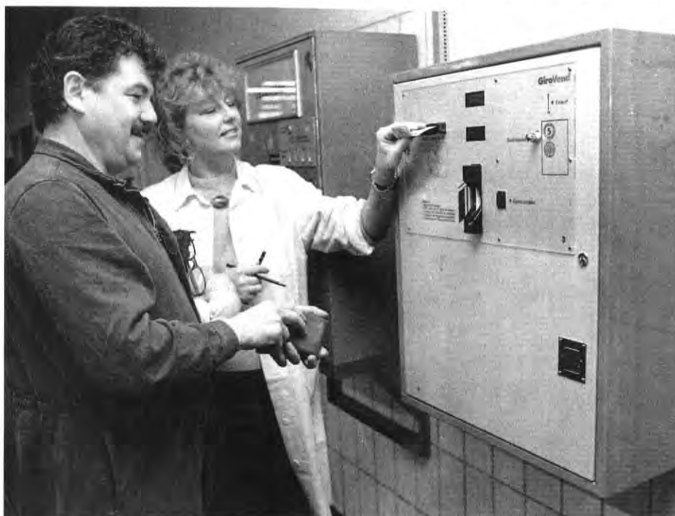
Guter Appetit: So kommt Guthaben auf die Menu-Card.

Anschrift der Redaktion: Adam Opel AG, Öffentlichkeitsarbeit, Red. Opel Post, Postfach 1710, 6090 Rüsselsheim, Telefon 061 42/66-40 57, -38 98, Telefax 061 42/61 598