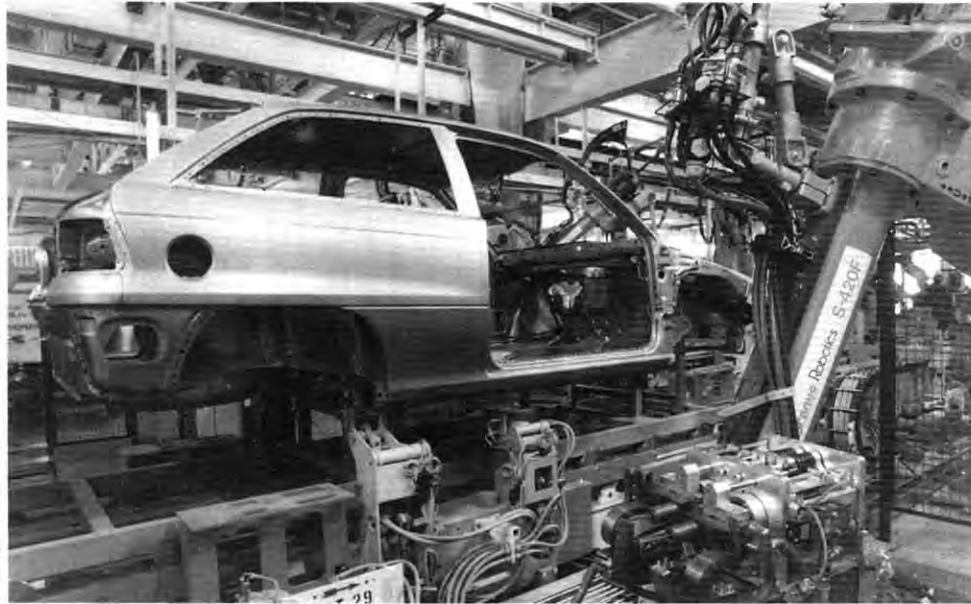
Training in Eisenach: Astra-Produktion wird vorbereitet

In den Werkshallen sind Fachfirmen und Ingenieure des Technischen Entwicklungszentrums damit beschäftigt, die Produktionswerkzeuge und Förderanlagen zu installieren. In der 240 Meter langen und 54 Meter breiten Lackiererei wartet schon alles auf den 16. Juni 1992. An diesem Tag wird Bundesumweltminister Klaus Töpfer den weltweit modernsten Lackierbetrieb starten und die erste Astra-Karosserie rollt durch Tauchbecken und Spritzkabinen. Dort verarbeitet Opel erstmals ausschließlich wasserverdünnbare Lacke und setzt damit neue Maßstäbe in