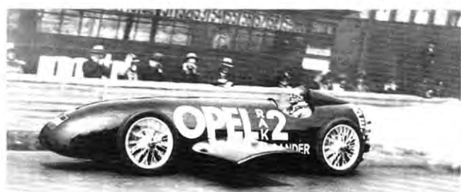
Publikumsmagnet: Rak 2

mensgründers, am 23. Mai 1928 auf der Berliner Avus eine Höchstgeschwindigkeit von 228 km/h erzielte. Der durch den Einsatz von 24 Feststoffraketen ermöglichte Rekord hielt bis zum Jahr 1934. Mit von der Partie war auch der Rennwagen von 1913, der damals schon über die fortschrittliche und revolutionäre Ventiltechnik verfügte.