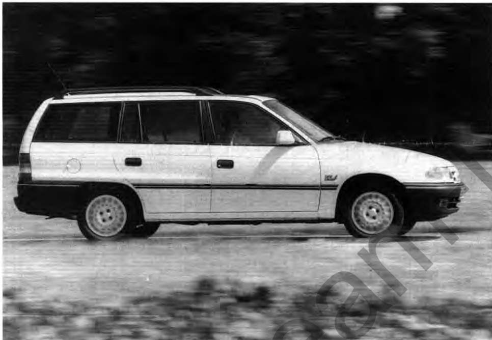
Käufergunst: Viel Laderaum fürs Geld

Profi-Fotograf Bilder – hauptsächlich natürlich von den kleinen Akteuren. Am Freitag, den 5. Juni und Dienstag, den 9. Juni sind die Fotos im Ausstellungsraum (Marktstraße) zu sehen. Wer seine lieben Kleinen entdeckt hat, kann das Bild gleich mitnehmen – kostenlos! Öffnungszeiten: Von 9.00 bis 16.00 Uhr. op