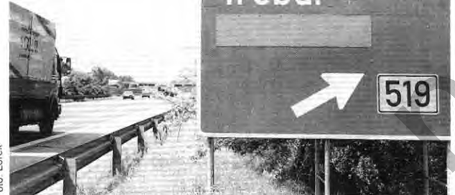
Auf rechtem Weg: Pfeile führen zu Opel