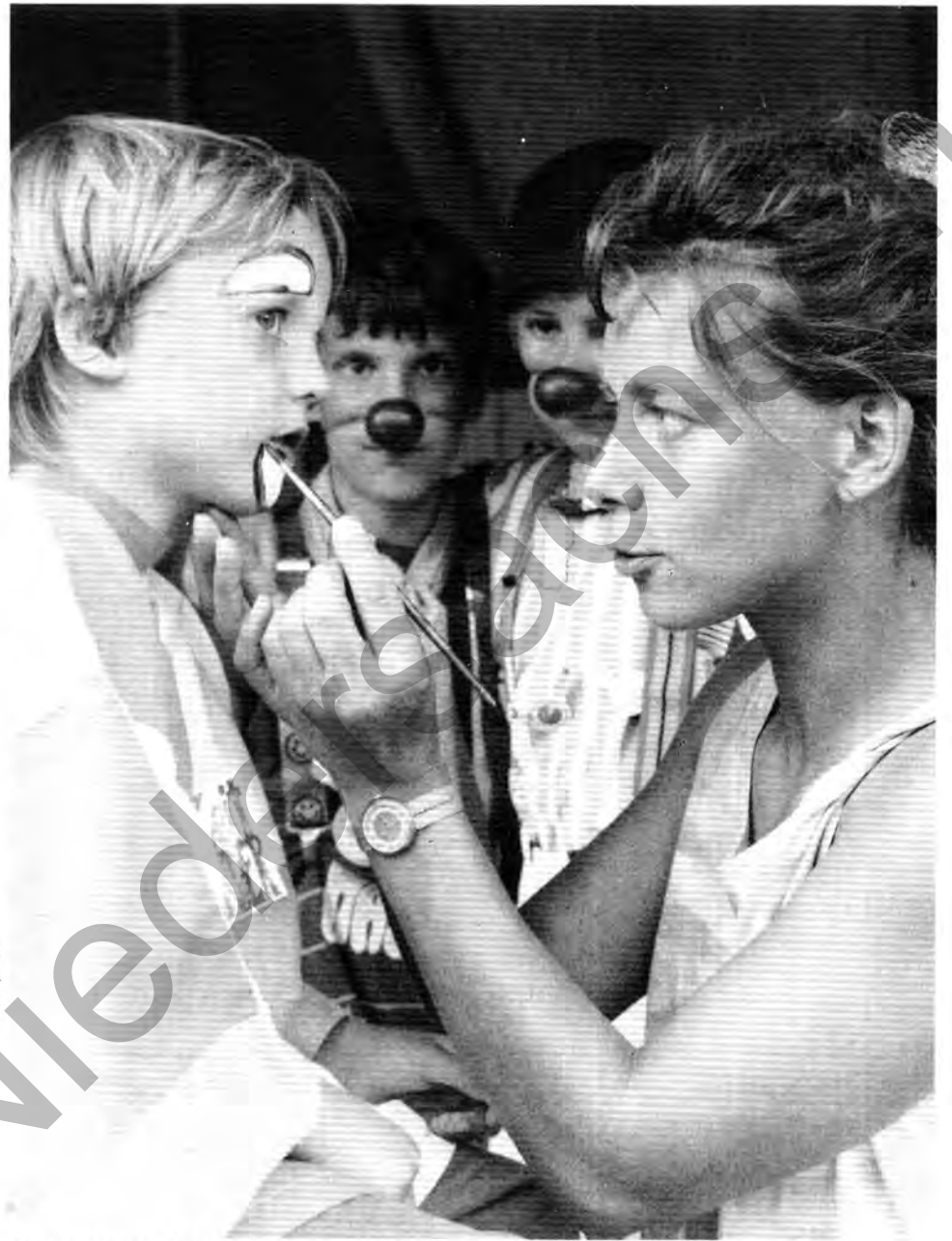
Maske: Passende Bemalung gehört dazu

Nicht nur den Kleinen und Kleinsten bot der Zirkus Unterhaltung. Am Sonntag und Montag standen die Zeltwände besonders auch für Jugendliche und Erwachsene offen. Eine Gala wechselte sich mit Kabarett und „Disco im Zelt“ ab.