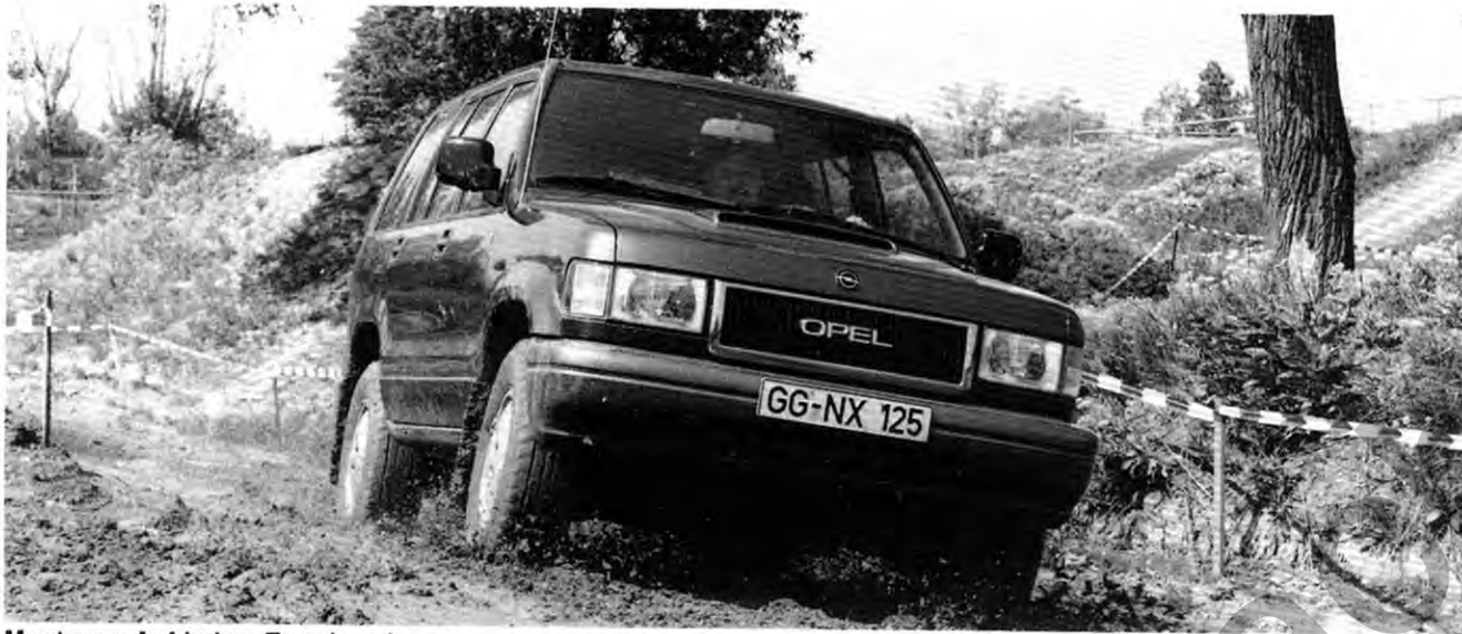
Monterey: Auf jedem Terrain zuhause

Beide Gruppen konnten sich davon überzeugen, daß der Monterey überragende Geländetauglichkeit mit Limousinen-Komfort in perfekter Weise vereinigt.