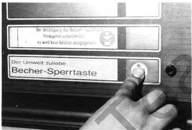
Sperrtaste: Auf Knopfdruck ohne Becher

in der Maschine. Eigene Tasse unterstellen und Knopf drücken – und schon wird wieder ein bißchen Müll vermieden. flo