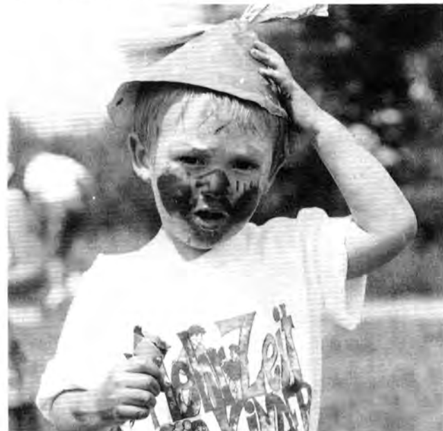
Rollentausch: Kinder als Darsteller