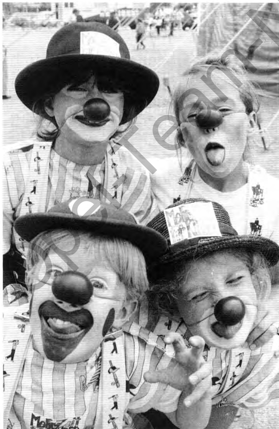
Begeisterung: Clowns sind immer noch die Lieblinge der Kleinen