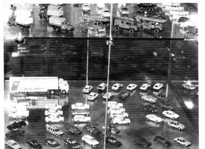
Vielfalt: Vom Sattelzug bis zum kleinsten Personenwagen