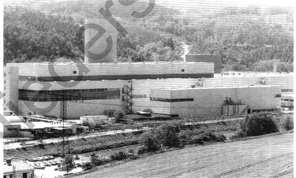
Opel-Werk in Thüringen: Warten auf den großen Tag

ginnt die Wegweisung bereits wesentlich früher auf der Autobahn Darmstadt-Mainz. Damit ist für Ortsfremde klar: Über die Ausfahrt Rüsselsheim Süd geht es zu Opel. op