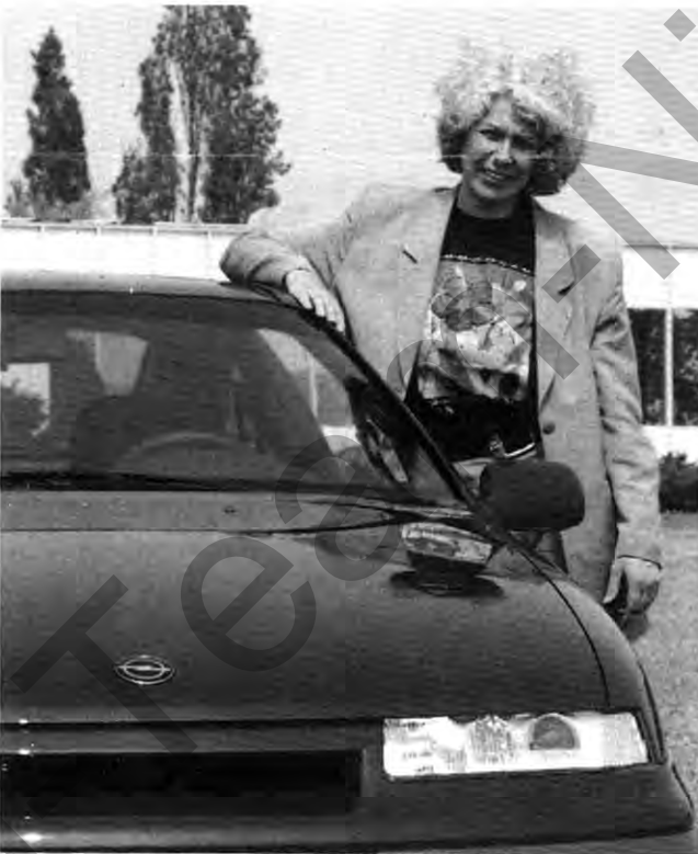
Partner: Heide Rosendahl mit ihrem Calibra