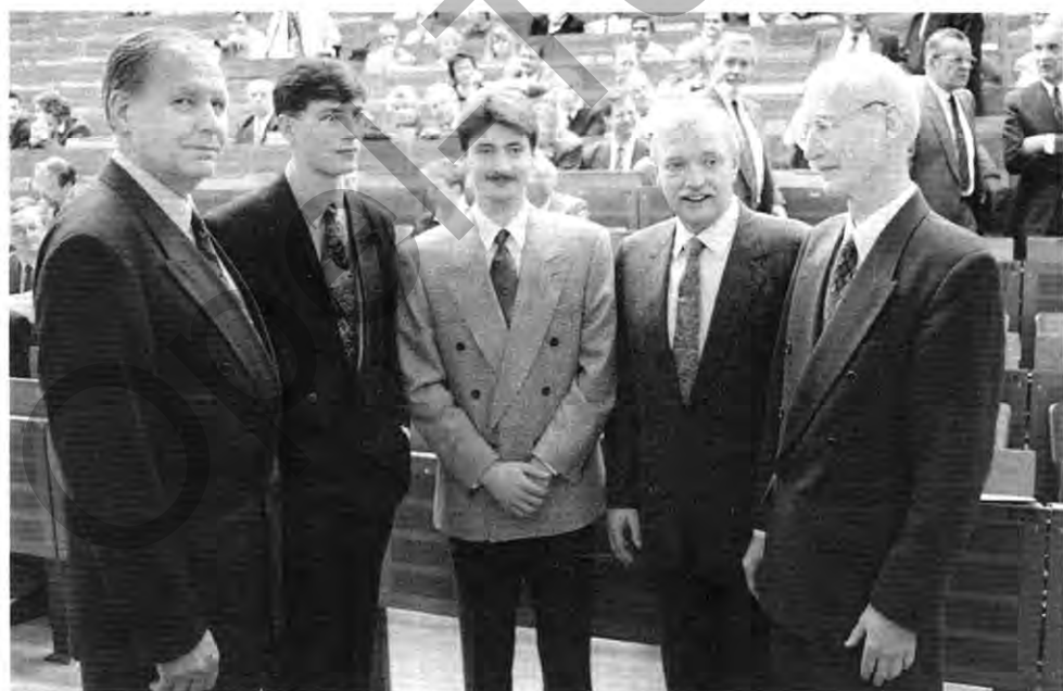
Preisverleihung: Werkdirektor mit Studenten und Professoren