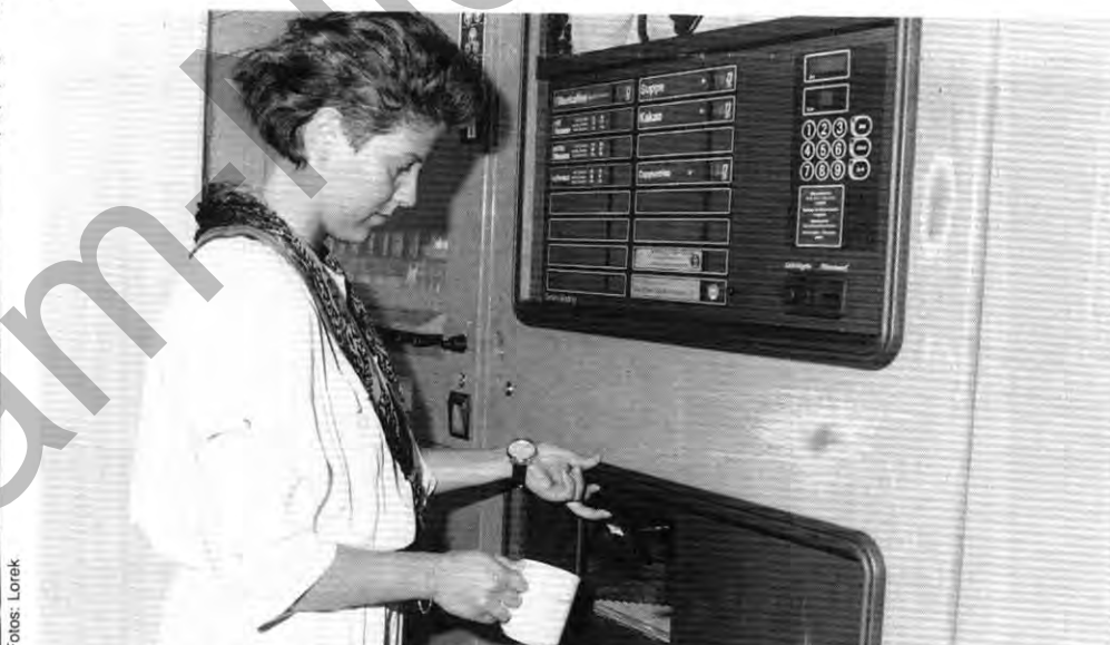
Müllvermeidung: Kaffee aus dem Automaten in der eigenen Tasse