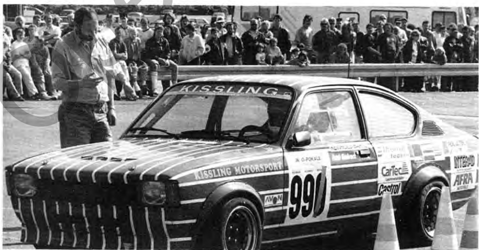
Werksbesuch: Ruhr-Slalom in Bochum