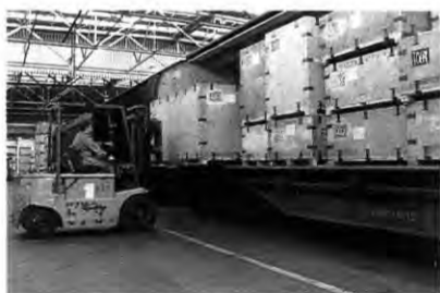
Autozug: CKD-Teileversand per Bahn

Apropos Mannschaft: Der Erfolg des Bochumer CKD-Bereichs rührt nicht zuletzt daher, daß hier wirklich Hand in Hand gearbeitet wird. Das fängt schon bei der Verpackung an. So entwerfen die sechs Mitarbeiter der CKD-Schreinerei die Versandkisten exakt so, wie sie später in der Packerei benötigt werden. Schließlich sollen die Teile den Transport auch bei