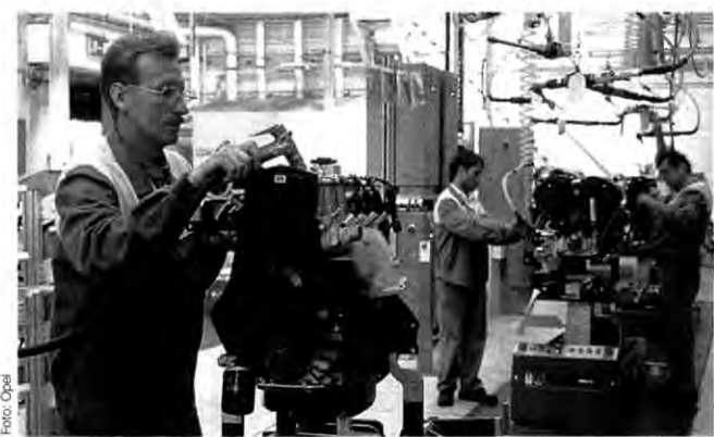
Bahnhof Opel, 1994: Auf zwei Montagelinien im 1928 erbauten, früheren Verladebahnhof – heute K 1 – bringen Opel-Mitarbeiter die in verschiedenen Baustufen angelieferten Aggregate auf einen einheitlichen Ausrüstungsstandard

Die nächste Opel Post ist für den 8. Februar geplant. Anzeigenschluß dafür ist am 4. Januar.