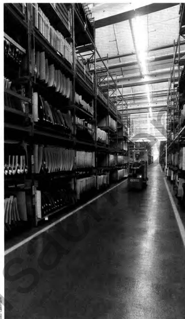
Schwindelerregend: Die neuen Regale sind über acht Meter hoch

Doch auch sonst hat sich im Großteilelager im K 65 einiges verändert. So ermöglicht beispielsweise eine Regalsprinkleranlage die reibungslose Lagerung von Waren diverser Brandgefahrklassen. Und neue Energiesparlampen leuchten den Arbeitsplatz der 115 Mitarbeiter in diesem Bereich besser aus.