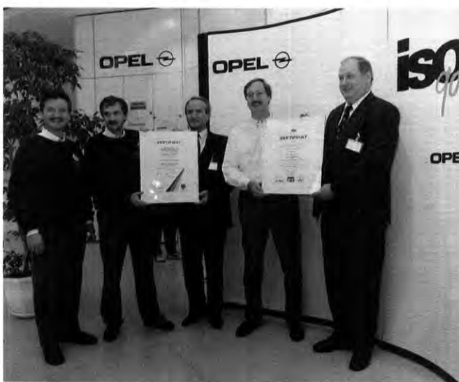
Gutes Timing: Eisenach wurde am „Weltqualitätstag“ zertifiziert