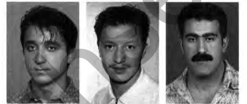
ein Problem nicht gültlich lösen läßt