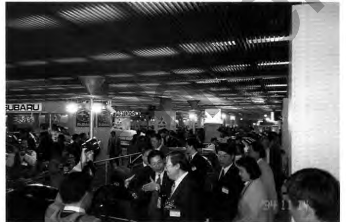
Aufgepaßt: Die chinesischen Besucher erschienen zahlreich