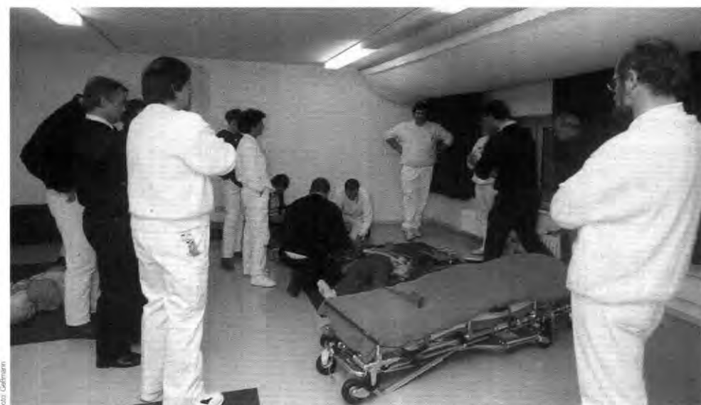
Schule fürs Leben: Die Opel-Ausbildung verbindet Theorie und Praxis

„Ein voller Erfolg“, lautete die einhellige Meinung der Kurs Teilnehmer über die gelungene Kombination von Theorie und Praxis. Diese kommt insbesondere den Mitarbeitern, aber auch im Notfall dem Kreis Groß-Gerau zugute.