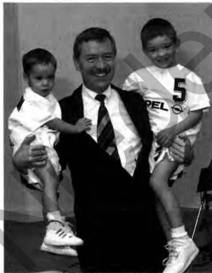
Wenn der Vater mit den Söhnen...