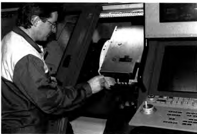
Knopdruck: Die CNC-Maschine arbeitet voll computergesteuert