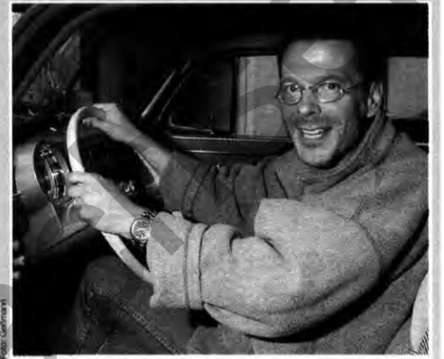
Fasziniert: Reinhard Mey am Steuer des Kapitän

„Manchmal“, so der Sänger, „muß man wohl 52 Jahre alt werden, damit ein Jugendtraum in Erfüllung geht.“