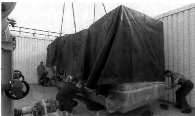
Maßarbeit: Das 15-Tonnen-Ungetüm schwebt ein

Eine Entlastung der Umwelt also – ebenso wie die Absorptionskältemaschine im Keller. Diese nutzt Abwärme, um das Kältemittel zu verdampfen. „Das gleiche Prinzip wie bei