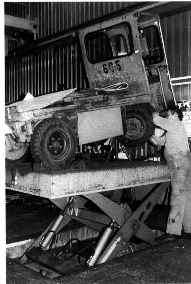
Einblick: Wolfgang Bienik repariert ein „Elektro-Auto“