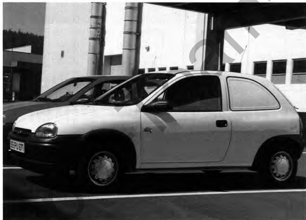
Große Klappe: Der Corsa Van bietet Handwerkern und Kleinlieferanten reichlich Platz