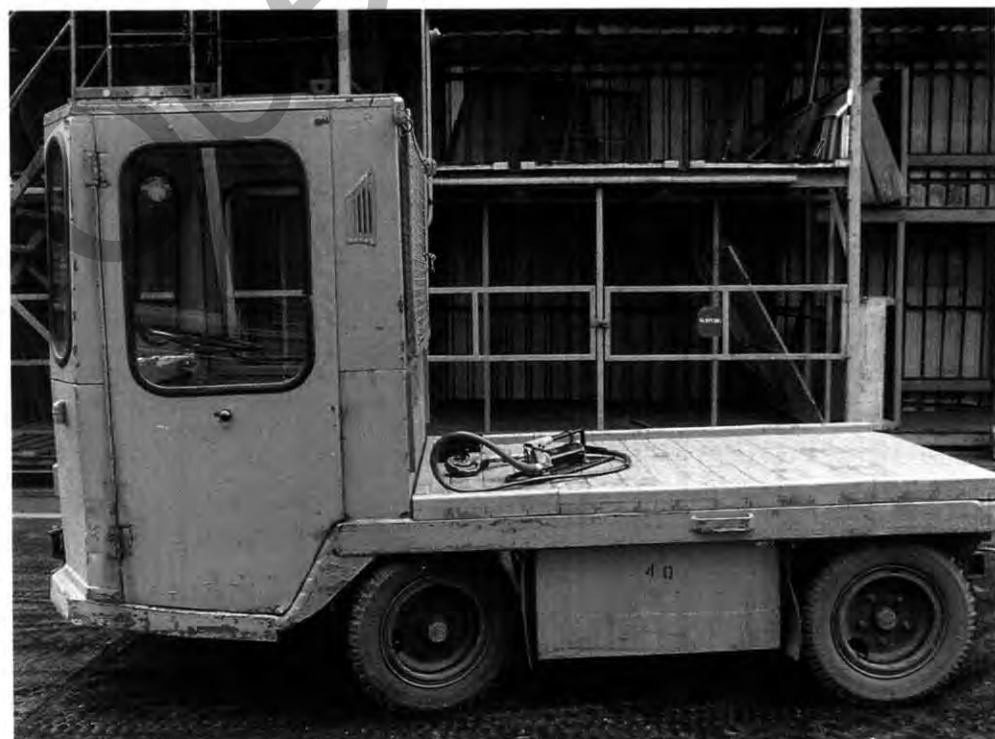
Oldie but Goldie: Auch die älteren Semester leisten noch wertvolle Dienste