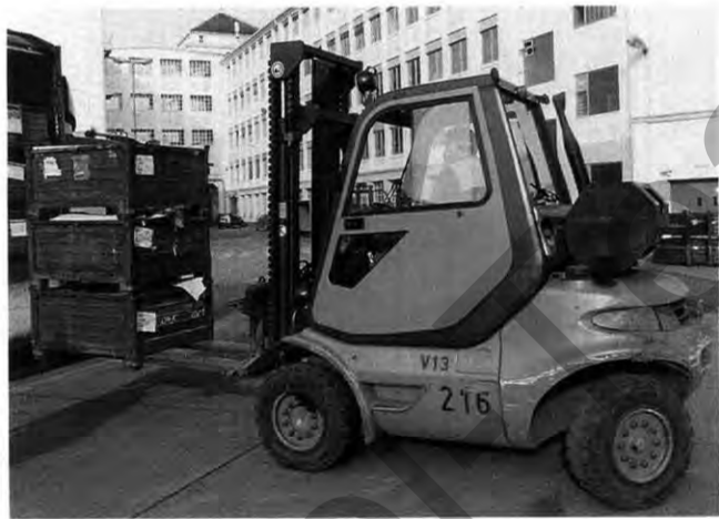
Krafteier: Bis zu elf Tonnen heben die Stapler

tung gehören. An der hohen Qualität und dem großen Engagement des Werkstatt-Teams wird sich unterdessen nichts ändern, so Günter Ritter: „Wir sorgen dafür, daß hier alles rollt.“