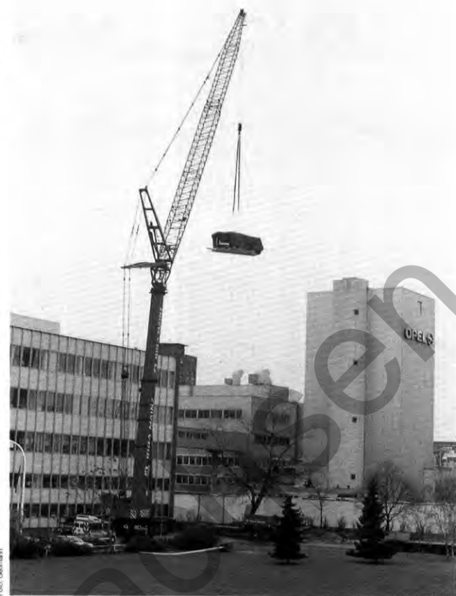
Immer schön cool bleiben: Ein Kühlturm auf dem Weg nach oben

Vorteilen für die Umwelt auch noch 600 Kilowatt mehr. Insgesamt bringen die neuen Kühlmaschinen 3900 Kilowatt Kälteleistung. Anfang Mai 1995 soll das neue System in Betrieb gehen – rechtzeitig zum Beginn der warmen Jahreszeit.