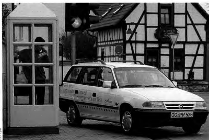
Unter Strom: Die Telekom testet fünf Astra Caravan Impuls

Mit dem Telekom-Feldversuch gewinnt die Adam Opel AG weitere Erfahrungen auf dem Gebiet des Elektroantriebs. Seit 1993 engagiert sich das Unternehmen auch an dem Elektroauto-Feldtest auf der Insel Rügen, wo derzeit zehn Astra Caravan Impuls ihren Dienst verrichten.