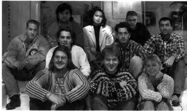
Problembewußt, aber gut gelaunt: Die JAVler aus dem Stammwerk

Rüsselsheim (he). Ärger mit dem Chef? Streß mit dem Ausbilder? Nix als Prügel an der Maschine? Da hilft nur eins: die Beine in die Hände und ab zur Jugend- und Auszubildenden-Vertretung (JAV). Wenn es um die Rechte der Auszubildenden geht, kommen die JAVler in sensationeller Zeit von 0 auf 100.