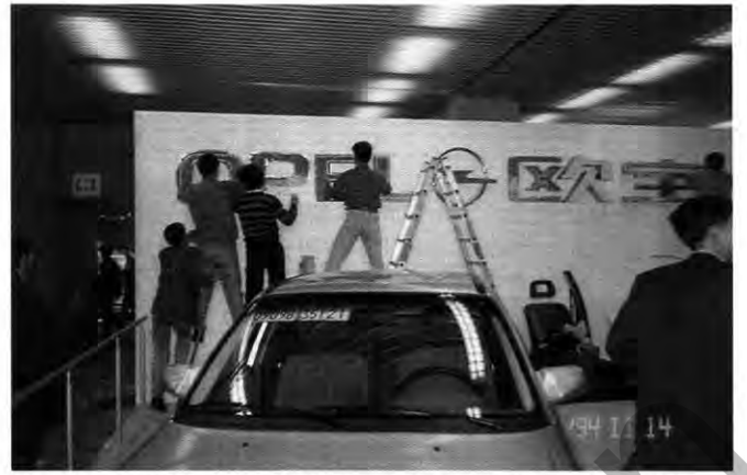
Herausgeputzt: Der Opel-Messestand im World Trade Center

Und nach der gelungenen Präsentation in Peking hat Opel gute Chancen mitzumischen, wenn es in China so richtig losgeht.