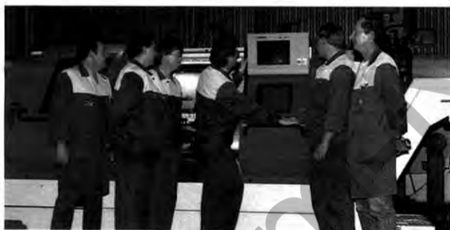
Raumschiff-Besatzung: Das Team hat alle Hände voll zu tun

Kaiserslautern (ah). In sattem, glänzendem Rot steht das gute Stück im K 18. Das Äußere erinnert eher an ein Raumschiff als an eine Werkzeugmaschine: Die neue CNC-Drehmaschine in den Zentralwerkstätten bietet völlig neue Möglichkeiten bei der Herstellung und Reparatur von Teilen.