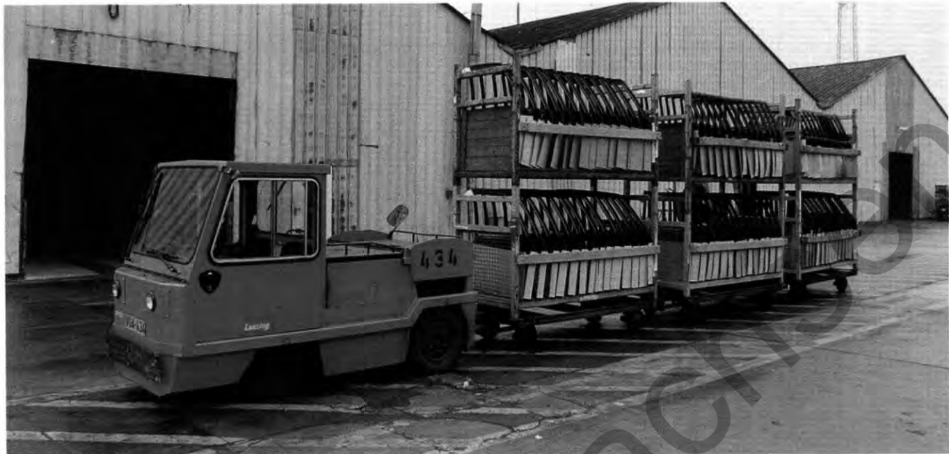
So kennt sie jeder: Die „stummen Diener“ bewegen täglich tonnenschwere Lasten durch das Werk

Mittlerweile genießt der Oldie in der Feuerwehrrhalle seinen wohlverdienten Ruhestand.