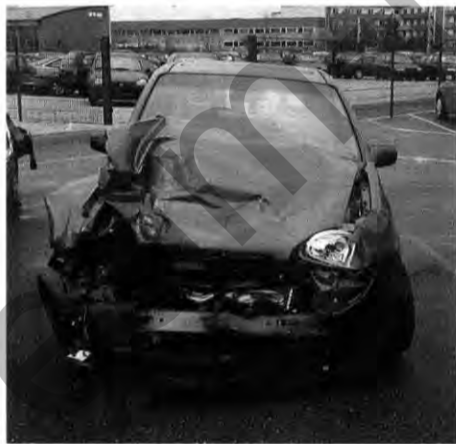
Totalschaden: Das Unfallauto

Nicht nur, daß der Airbag einwandfrei funktionierte, trotz des gewaltigen Aufpralls und der auf dem Foto gut zu erkennenden Verformungen.