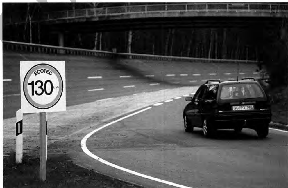
Ausgeschildert: Journalisten testeten die Ecotec-Triebwerke in Dudenhofen gemäß Tempolimit