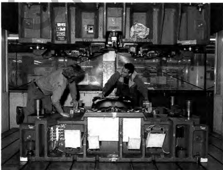
Oliver Adrian und Christoph Fähnrich (re.) an der Einarbeitungspressen

Zum anderen sind die Werkzeuge enormen Belastungen ausgesetzt. Sie müssen qualitativ so beschaffen sein, daß sie bei ihrem Einsatz in einer Großtransferpresse bis zu 20 Teile pro Minute bearbeiten können – und das rund um die Uhr im Drei-Schicht-Betrieb. Eine Aufgabe für Spezialisten, von denen der Preßwerkzeugbau 390 beschäftigt.