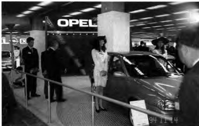
Blickfang: Der Corsa als Stufenheck-Variante

Und das, obwohl China alles andere als ein blühendes Wirtschaftswunderland ist.