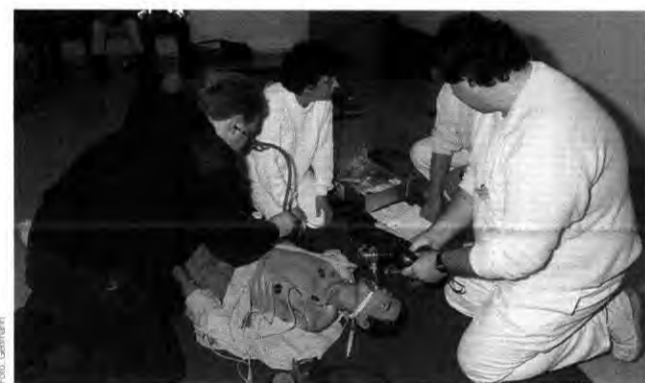
SOS: Sanis proben Ernstfall am (fast) lebenden Objekt