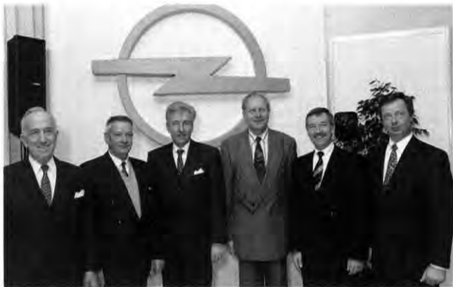
Ehemaligentreffen: Fünf Bochumer Ex-Direktoren und der „Neue“