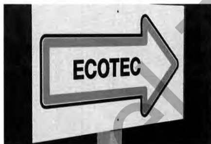
Opel zeigt die richtige Richtung an