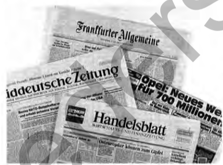
Medienecho: Gute Presse für Opel

Alein die Zahlen zeigen, daß die Zeitungen nicht übertreiben: Mit Gesamtaufwendungen von rund 700 Millionen Mark wird Opel seinen hessischen Standort bis Anfang 1997 total neu strukturieren. Dabei werden die Produktionsflächen um ein Drittel oder 400 000 Quadratmeter reduziert.