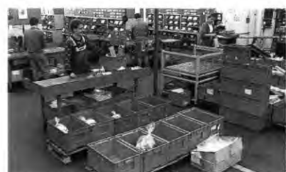
Abgezählt: Ein Set enthält 24 Teile

Bis zu 2 500 diverse Positionen kommen in Bochum in die Kiste – von der Unterlegscheibe bis zum Autodach. Da ist Präzision und Übersicht gefragt, um komplett und termingerecht liefern zu können. Zumal der Bochumer CKD-Bereich mit anderen Werken kooperiert.