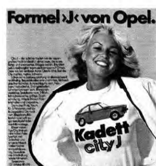
Formel J von Opel. Gutes Auto. Guter Preis. ... und gestern

Darüber hinaus bietet die Ausstellung auf 1 000 Quadratmetern originale Raritä-