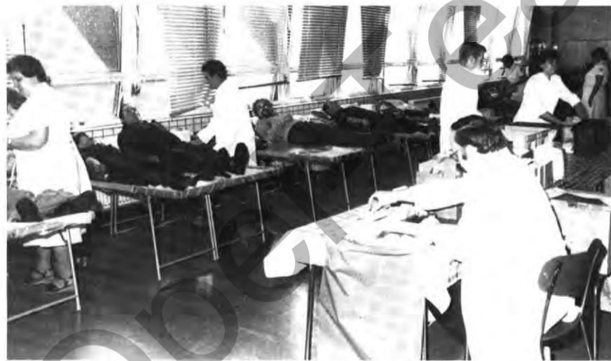
Gut vorbereitet — gut verlaufen. Die Blutspende im Werk II.

In den letzten Tagen ging vom Blutspendedienst des Deutschen Roten Kreuzes in Hagen ein Schreiben ein. Darin heißt es unter anderem: „Das Institut in Hagen bedankt sich bei den Blutspendern des Opel-Werkes Bochum recht herzlich. Sie trugen dazu bei, Engpässe in der Versorgung der Krankenhäuser, Heilstätten und Geburtskliniken zu überwinden.“