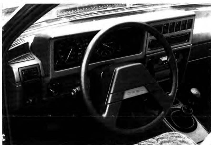
Weitere Aufnahmen vom neuen REKORD. (Ergänzende Illustration zu unserem Bericht auf Seite 1 dieser Ausgabe.)