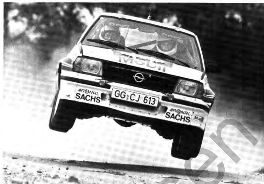
Hoppla! Unsere Rallye-Youngster gehen hart ran.