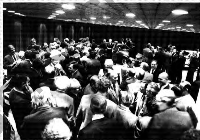
Gratulanten aus dem gesamten Unternehmen im Ausstellungsraum.

de, müsse die Zahl der Beschäftigten durchaus nicht zwangsläufig abnehmen. Rationalisiere man aber nicht, dann gefährde man die Wettbewerbsfähigkeit des Unternehmens, was wiederum eine Gefährdung der Arbeitsplätze nach sich ziehen könnte.