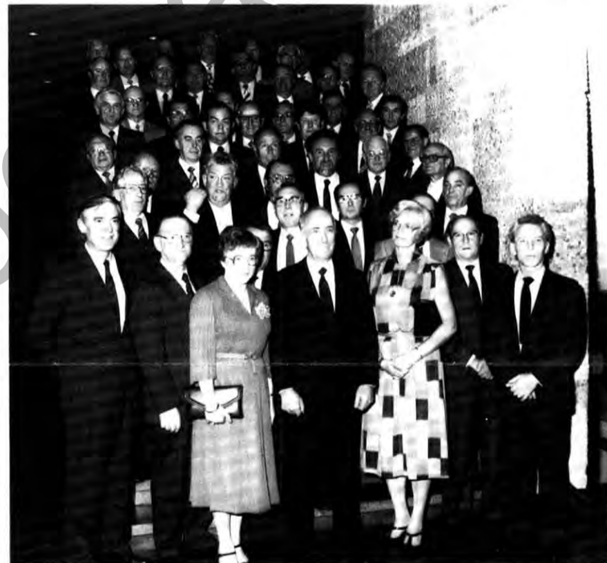
Erinnerungsfoto mit den Jubilaren mit 40jähriger Werkszugehörigkeit.

Für ihn sei dies besonders die erste Zeit bei Opel nach seiner Übersiedlung aus der DDR gewesen, als er ans Band im damals gerade eröffneten K 40 gestellt worden sei. „Diese Arbeit am Band war eine enorme Umstellung für mich. Früher eine Tätigkeit mit freier Zeiteinteilung – und jetzt eine nach dem Motto: ‚Der nächste Wagen kommt bestimmt!‘ – Das war nicht leicht, ja, im nachhinein muß ich sagen, daß es eine sehr schwere Zeit für mich war...“ Der Jubilarsprecher, der in späteren Jahren noch einmal die Schulbank betrieblicher Aufbaulehrgänge und die einer Techniker-Schule