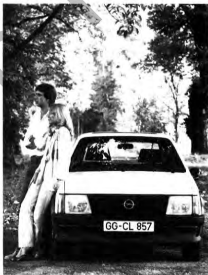
Fahrt in den bunten Herbstwald.

Ein neu abgestuftes Vierganggetriebe und ein neues Fünfganggetriebe tragen zum gebremsten Durst des neuen Rekord bei. Mit dem Fünfganggetriebe braucht der 1,8 S bei konstantem Tempo 90 ganze 5,9 Liter Superbenzin auf 100 Kilometer. Die übrigen Benzin-Motoren: Ein neuer 1,8 N (OHC) mit 55 kW (75 PS) sowie bewährte CIH-Vierzylinder 2,0 S (74 kW/100 PS) und 2,0 E (81 kW/110 PS). Mit diesem Einspritzer, dem leistungsstärksten Motor, beschleunigt der Rekord