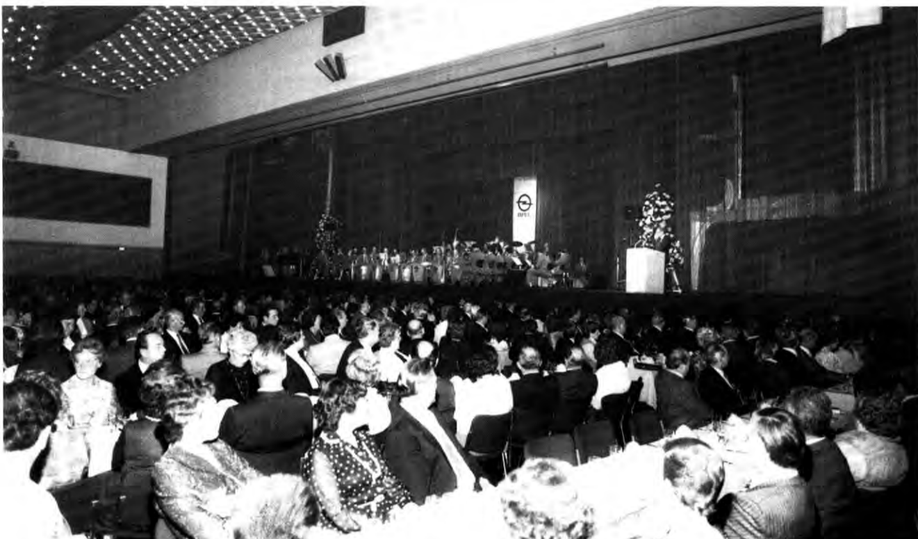
Blick auf die Bühne der Rheingoldhalle während des akademischen Teils. 1.400 Personen – Jubilare, Ehepartner Vorgesetzte und Gäste – füllten das weite Rund des Saales bis auf den letzten Platz.