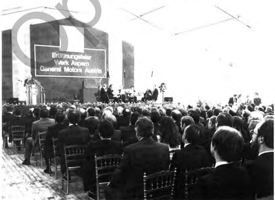
Blick auf die Festversammlung der Eröffnungsfeier des Werkes Aspern.

Lassen Sie mich bitte abschließend noch einen Dank aussprechen, nämlich an das Management von General Motors. Ich darf wohl stellvertretend für die gesamte Belegschaft erklären, daß wir voll und ganz hinter unserer Direktion stehen, wenn es um GM-Austria und seine Mitarbeiter geht...“